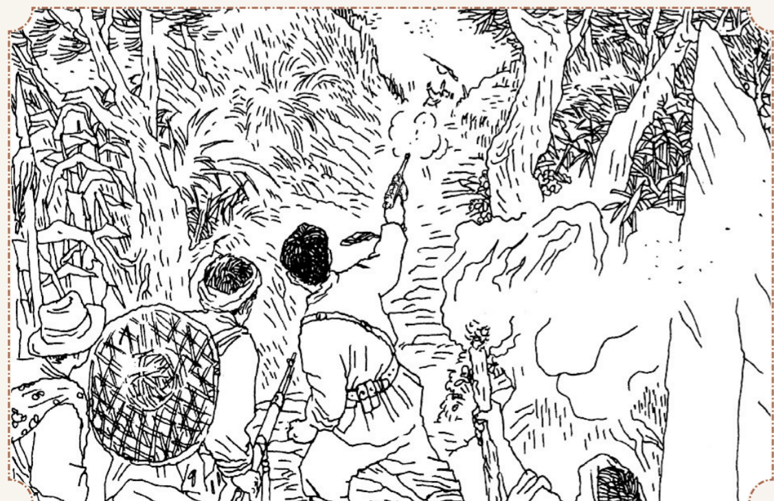
⑤ 当起义军靠近杨林寺山垭口时,一个乡丁突然从山垭口那边冒出头来。楼闾强扣动扳机,“砰”的一枪,刚冒出头的乡丁当即被掀翻在地。第二个乡丁冒出头来,又被一枪掀翻。后面的大队乡丁见到这阵势,全被吓跑了。