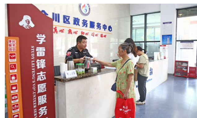
工作人员为群众提供开水