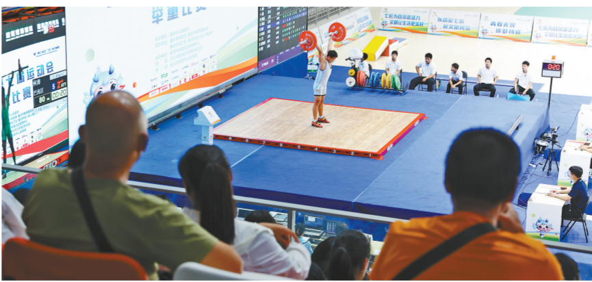
市民在场观看比赛

据了解,在24日的举重比赛结束后,26日和27日,又有跆拳道和羽毛球两个比赛拉开帷幕。其中跆拳道比赛在南城体育馆举行,羽毛球比赛在合川体育中心举行。市民朋友可以通过网上预约或持身份证现场登记进入场馆观看。