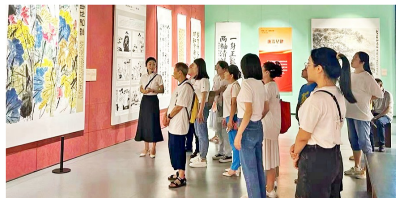
7月30日,钓鱼城街道蟠龙社区组织社区干部、网格员、党员代表、群众代表30余人到合川区美术馆参观“风正三江·廉润合川”主题书画展。

《指导意见》要求各地区各有关部门加强组织领导,强化综合评价,保障资金支持,确保各项措施平稳落地。(据《经济日报》)