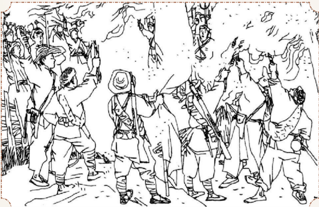
① 1948年8月26日拂晓,各路起义大军及农会会员1000余人聚集在金子乡六保二郎庙场坝。让小小的二郎庙,火把通明,刀枪如林,红旗猎猎。