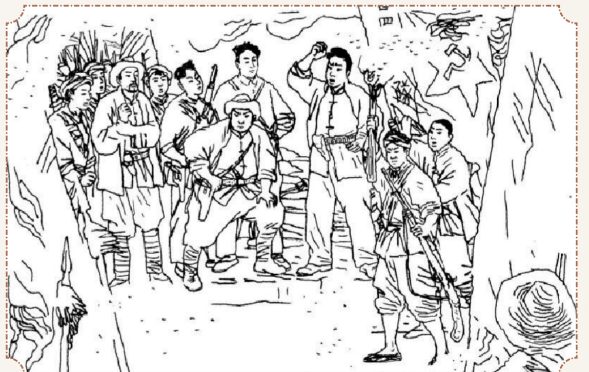
④ 接着,司令员陈伯纯也高声讲道:“为了翻身解放,为了平等自由,我们要揭国民党反动派的‘锅盖’,要砸碎蒋介石的坛坛罐罐,要在蒋家王朝的后院,狠狠点燃一把大火,彻底推翻反动、腐败的蒋家王朝!”