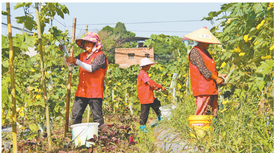
志愿者们帮助种植户采摘丝瓜