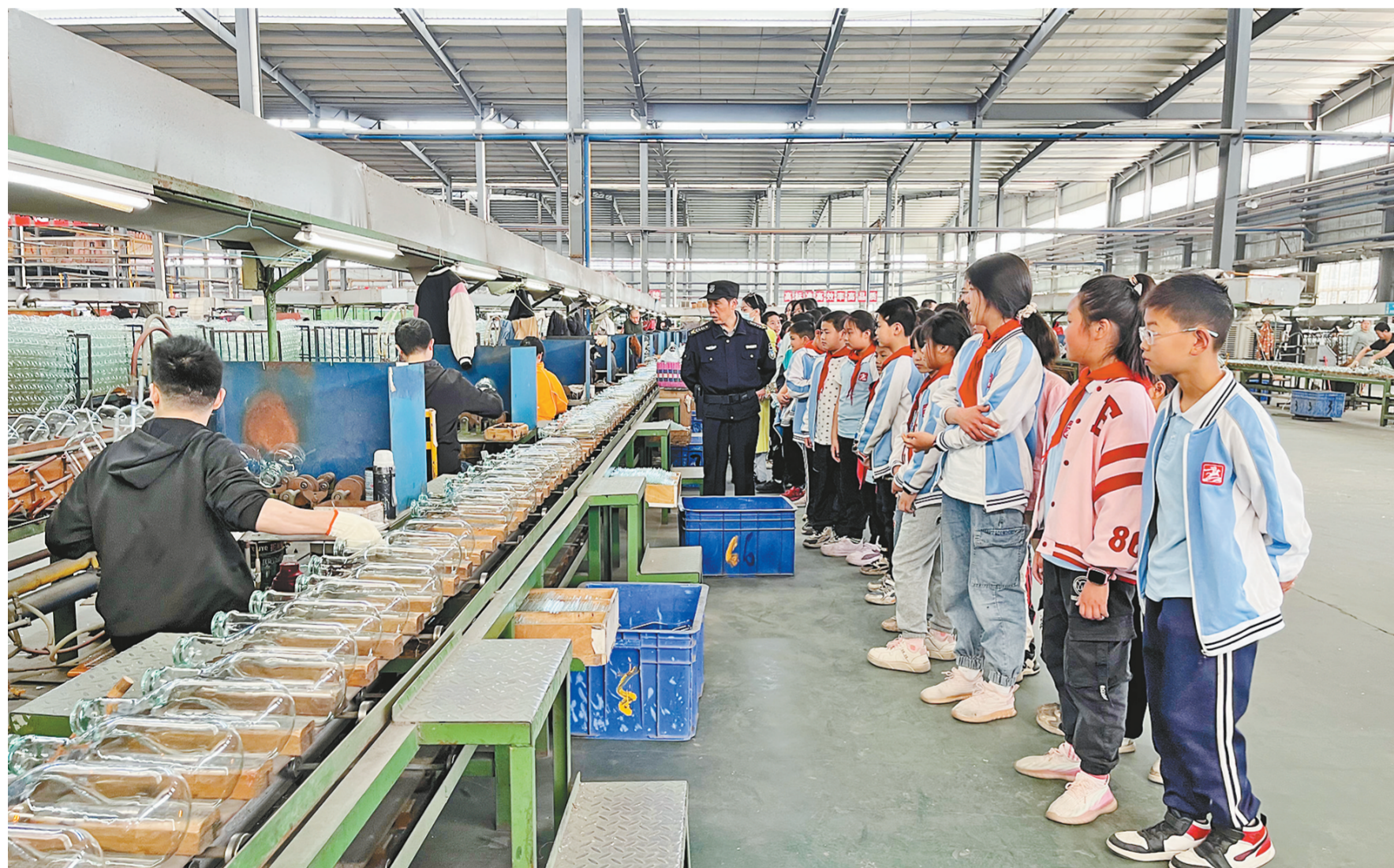
近日,五尊小学组织开展了“课堂助成长”活动。当天,在该校老师的带领下,学生们走进重庆天嘉日用品实业有限公司,实地参观了保温瓶的生产过程。