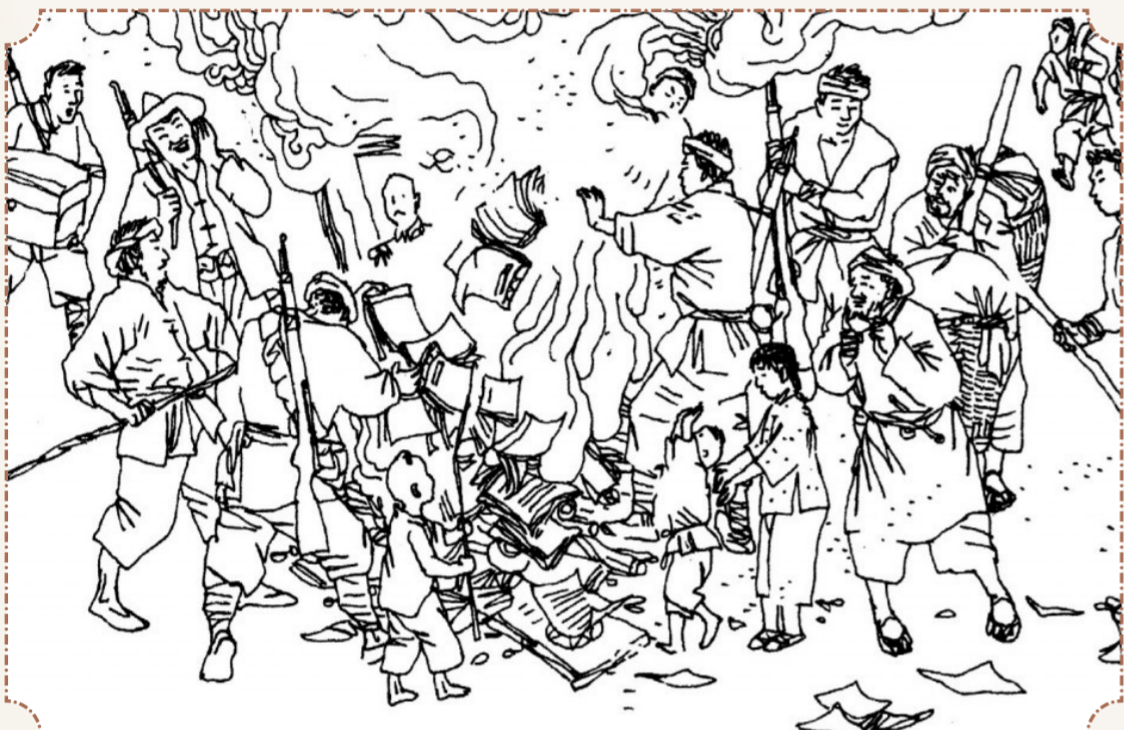
1 武工队员烧毁了乡公所蒋介石画像、国民党党旗等,砸烂了乡公所吊牌,并打开粮库,开仓济民。