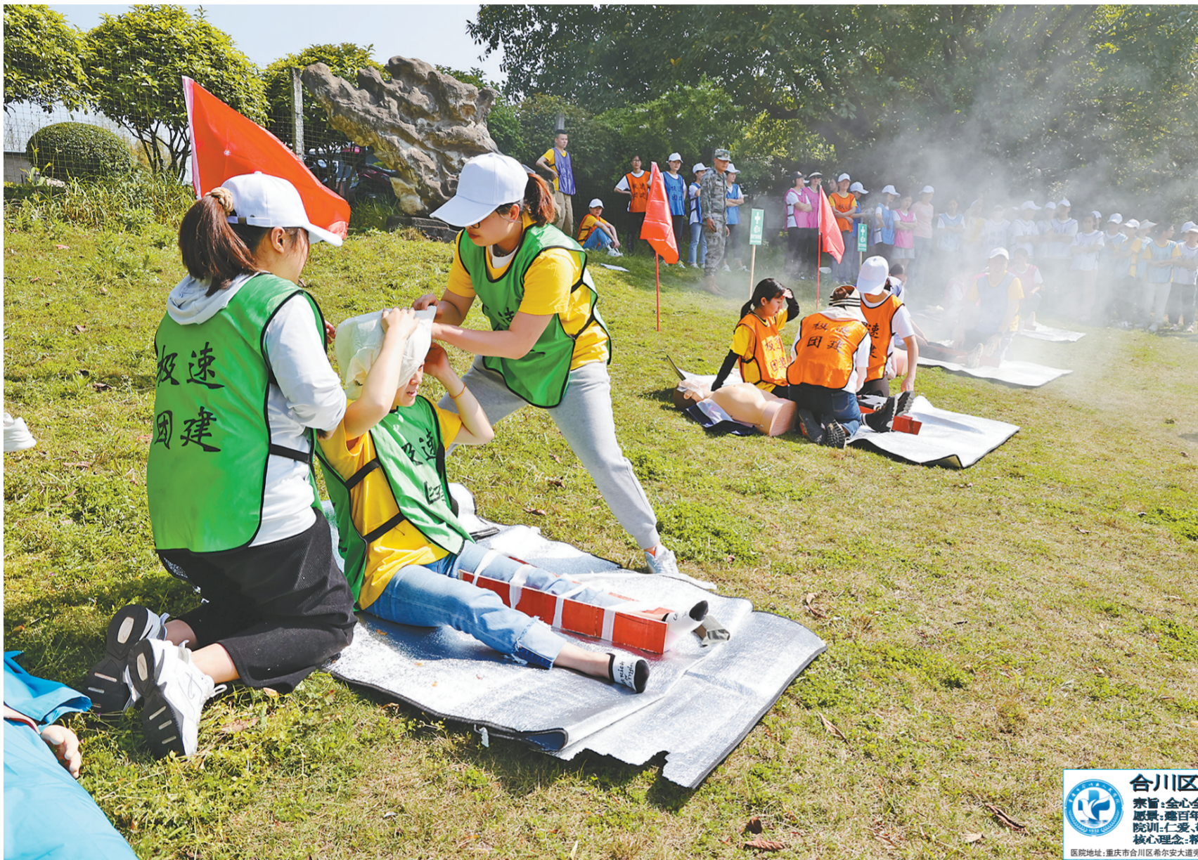
6月28日,区人民医院举办户外急救技能拓展大赛,激发护理人员展技能、练本领的热情,全面提升护理人员综合素质及应急响应能力。来自区人民医院的100余名护理人员参加了比赛。此次大赛既充分展现了该院护理人员的实践能力和精神风貌,也是对该院护理技能操作的一次大练兵。

区人力社保局、区医保局、区行政服务中心、合川瑞山中学的100余名女职工参加了活动。