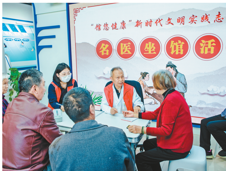
医生为群众义诊

“2”即聚焦“一老一小”两类重点群体,开展“家庭医生签约”“青少年健康校外研学”体验活动。合川区