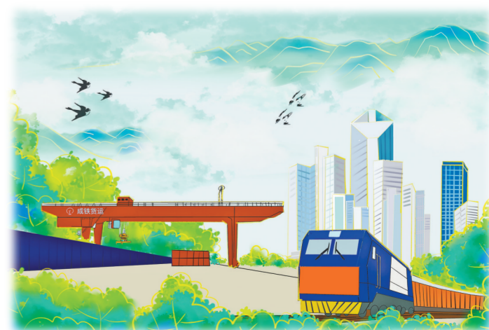
中欧班列(成渝)“武陵山号”列车

西部陆海新通道带来的便利和红利,吸引了越来越多的企业将产品通过武陵山国际铁路联运班列、东盟跨境公路班列借“道”出海,拓展国际市场,不仅为更多“秀山制造”“武陵加工”