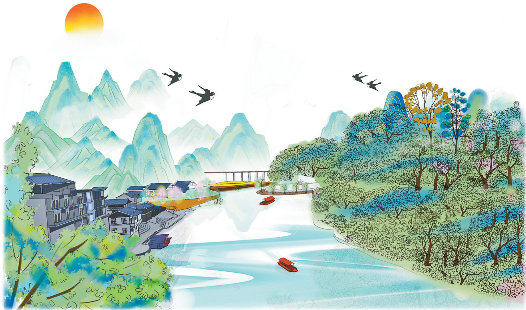
书中边城洪安古镇

近年来,秀山依托“一脚踏三省、三省共一城”的独特禀赋,便利的交通设施、丰富的旅游资源。在融合上下功夫,借力西部陆海新通道建设,聚力成势,描绘了一幅画里秀山新景象。 令人大开眼界,品川河上,茶叶青青,品茗之余,欣赏千高苗妹悠扬歌唱的秀山民歌《黄杨扁担》…… 山水言情见证发展,底蕴深厚引领前行。走进秀山,书中“边城”洪安古镇古朴浪漫,让人流连忘返,“川河盖风景如画,宛若‘云端花园’”。