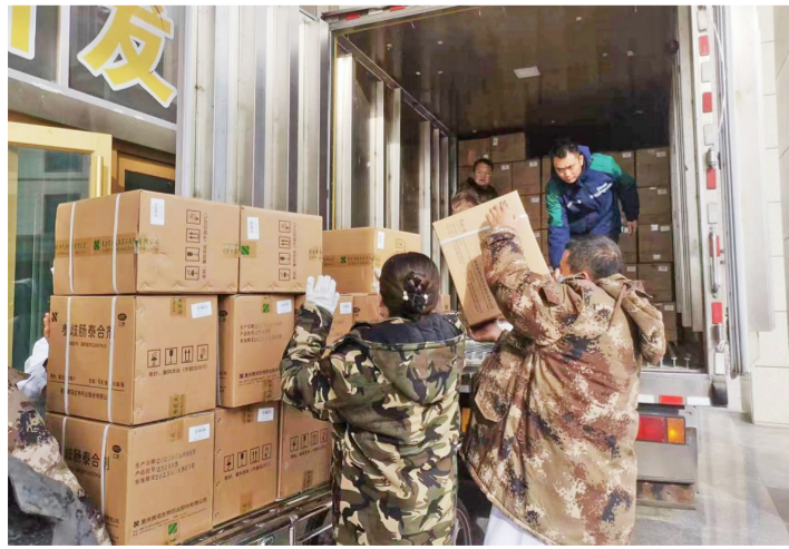
希尔安药业有限公司向灾区捐献药品

本报讯(记者 甘晓伟 摄影报道)2023年12月18日,甘肃省临夏州积石山县发生6.2级地震,灾情发生后,合川高新区管委会第一时间发出倡议,动员园区各企业、社会各界爱心人士向甘肃地震灾区捐款捐物,以众志成城的大爱精神向灾区群众传递爱心。