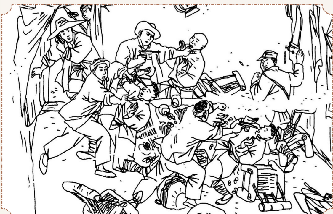
⑤ 一名武工队员突然拔出短枪,厉声吼道:“不许动,哪个动,就敲哪个的砂罐(脑袋)!”随即,战士们缴了乡丁的枪。