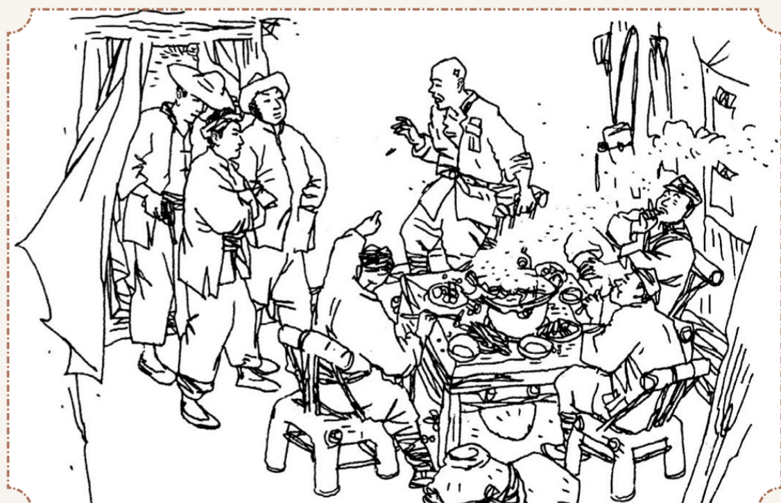
④ 正在喝酒吃肉的乡丁见一大群陌生人闯了进来,慌忙问道:“大白天闯乡公所,你们找死呀?”