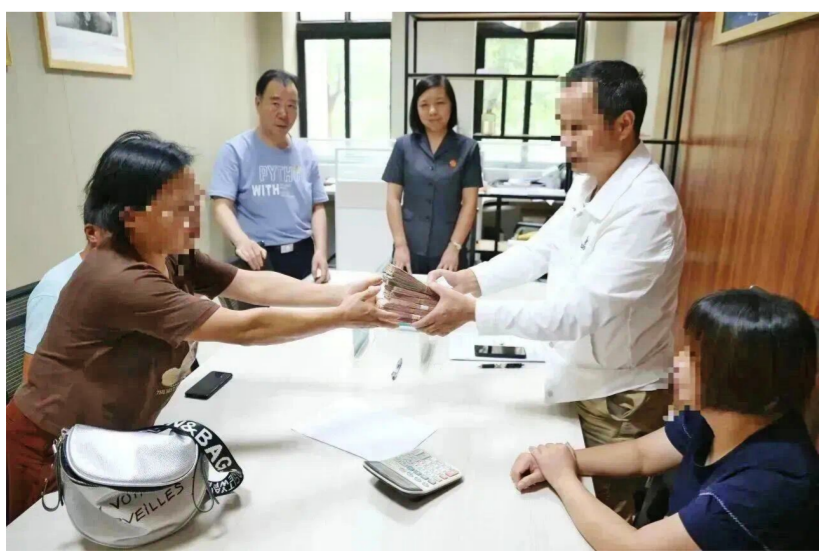
双方现场兑现执行款

本报讯近日,区人民法院诉前调解团队成功调解一起交通事故责任纠纷案件,调