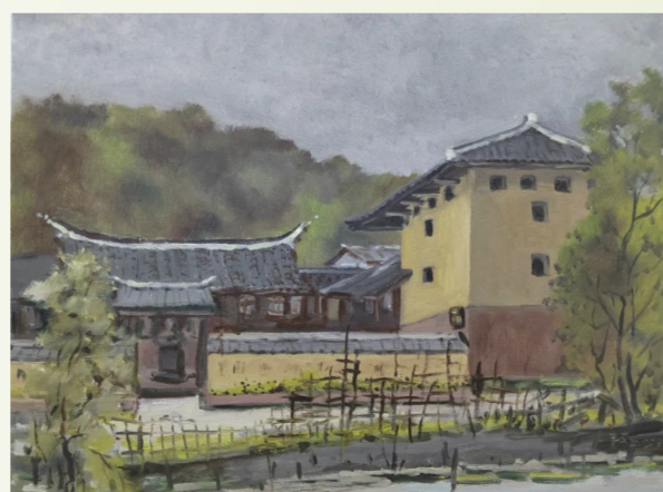
《烈士周吉可故居》罗孔友