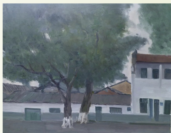
《太和镇政府大院一角》陈小飞