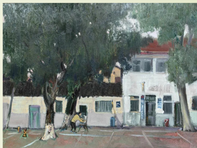
《太和镇政府大院》杨雷