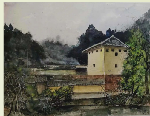
《周吉可故居》田朝文