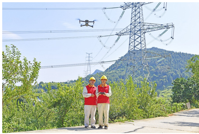
工作人员利用无人机巡线