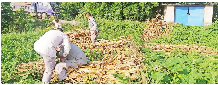
企业员工打捆回收秸秆

本报讯(记者 谌永恒 摄影报道)近日,记者获悉,盐井街道积极探索秸秆回收利用新模式,组织企业回收秸秆变废为宝,让秸秆变身“黄金秆”,实现经济生态“双丰收”。