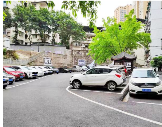
将军路134号院的小微停车场

团)公司等单位召开现场推进会,对桥下空间进行规划整治,全面清理“僵尸车”,拖离破损共享单车,并对桥下区域实施全面清洗消毒,完成路面平整,完善智慧停车系统等基础设施。目前,涪江二桥桥下小微停车场新增有效利用面积2000平方米,增加机动车泊位118个。将原本闲置的空间变为便利有序的停车场所,能有效缓解周边居民停车难问题。“区城市管理局相关负责人表示。