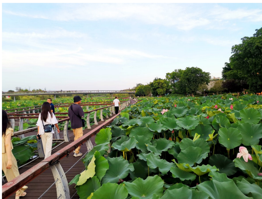
游客在圣莲岛世界荷花博览园内观光

此外,园内所有的灯光、雕塑、廊、桥等皆是风景,而这些景致又全采用莲的元素,整个景致和谐统一。园内主游