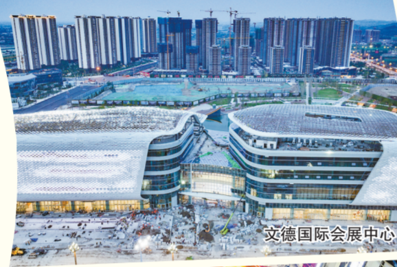
文德国际会展中心

征途漫漫,唯有奋斗。牢牢把握高质量发展这个首要任务,德阳正以事争一流的状态与唯旗是夺的决心,与最快者赛跑、与最强者比拼,全力推动各项工作最快速度启动、最高效率推进、最好效果呈现,奋力推进德阳在新征程上书写高质量发展新篇章!