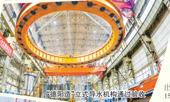
“德阳造”立式水机构通过验收