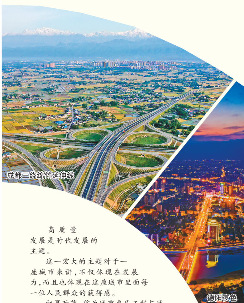
成都三绕绵竹延伸线