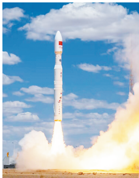
“绵阳星座”首发星“涪城一号”发射成功