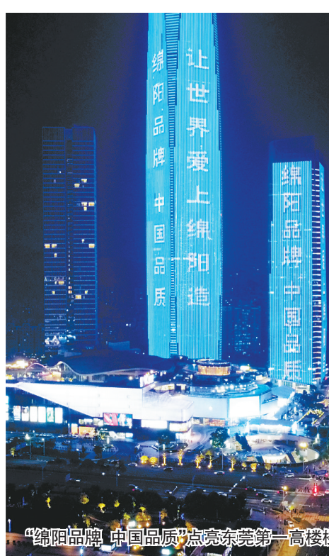
“绵阳品牌 中国品质”点亮东苑第一高楼楼体