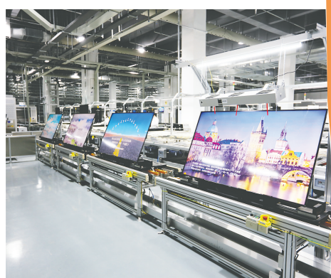
长虹国内首条“5G+工业互联网”生产线