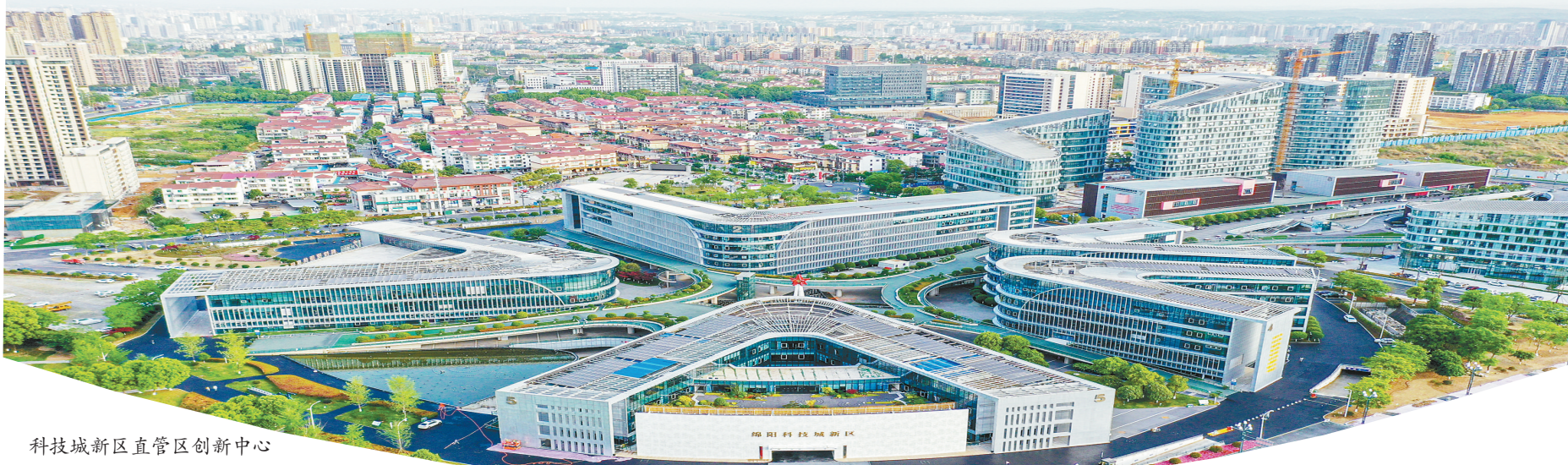
科技城新区直管区创新中心

盛夏时节,草木葳蕤、万物并秀。近日,“行进涪江·川渝九地高质量发展媒体调研行”联合采访报道组来到绵阳,大家深入企业、园区、科技城创新馆等地,探寻这座科技之城以科技创新助力高质量发展的探索奋进!