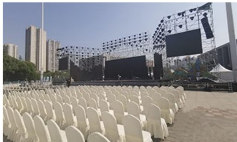
开幕式舞台搭建完成

另外,文化遗产宣传月暨非遗产品大集活动也将在文峰古街举行,活动将汇集川渝两地22个区县80余家非物质文化遗产商家在文峰古街开展产品展销、技艺展示,供游客购买非遗及文创产