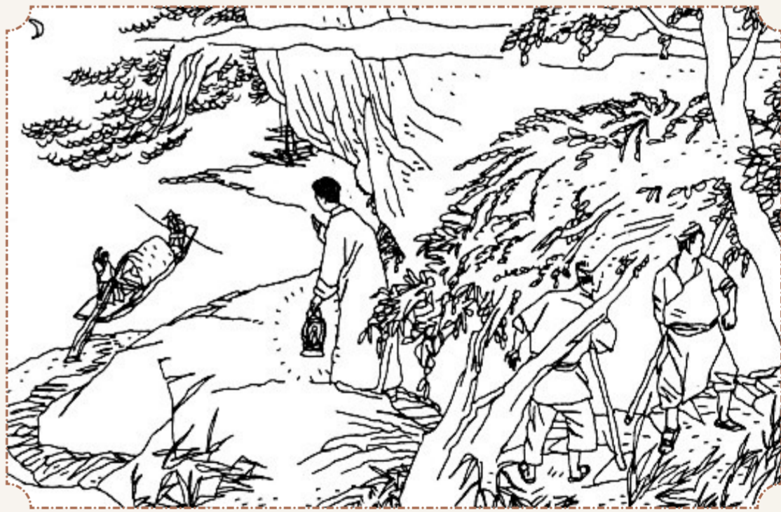
④ 因一位联络人被捕,张岚星身份暴露。刘石泉指示张岚星:“你的任务已完成,当务之急是转移外地隐蔽。”从此,张岚星离开金子沱,一直隐蔽到解放后。