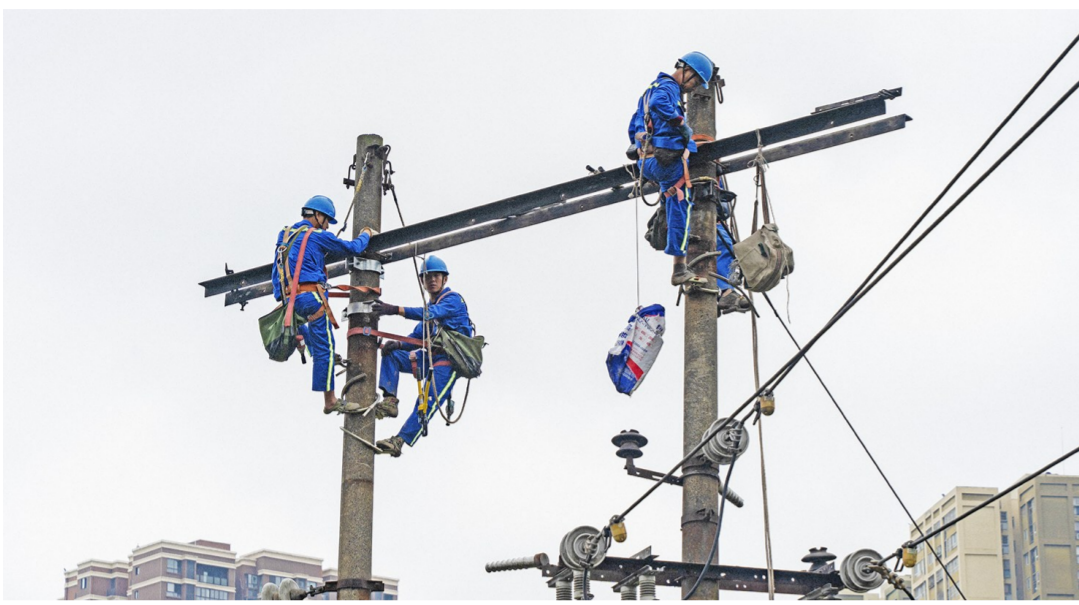
改造现场

本报讯(记者 任洋)5月6日,经过百余人12小时的连续鏖战,合川供电公司顺利完成东津沱老旧小区的全面检修及双电源改造,为电网“强筋壮骨”,全面提升了该片区的供电可靠性和稳定性,惠及