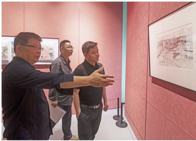
艺术家们参观作品展