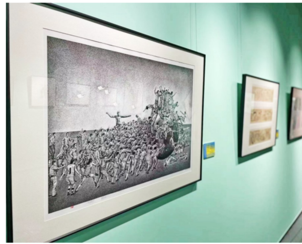
在区美术馆展出的部分全国名家特邀作品