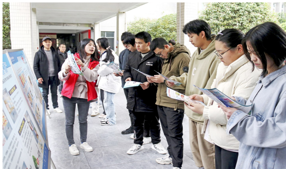
志愿者向学生宣讲法治知识

工作经验,运用通俗易懂的语言,向同学们讲述了什么是电信网络诈骗,常见的诈骗形式、如何防范电信网络诈骗,遇到电信诈骗时应该怎么办等一系列防诈骗知识,提醒学生们要提高安全防范意识,增强预防诈骗能力,如遇可疑情况,要及时与家人、老师进行沟通或拨打110报警,防止上当受骗。同时,街道党员志愿者还对禁毒、扫黑除恶、维护国家安全等相关知识向学生们进行了生动讲解,教育引导学生们增强自我保护能力,做一个知法、懂法、守法的青少年。