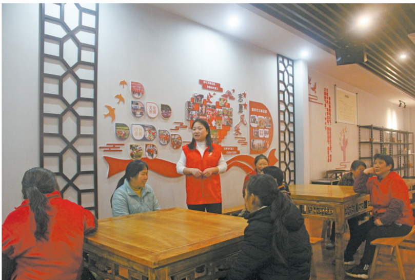
志愿者开展宣讲,弘扬善文化

别村民意见不一。为此,村里秉着公开、公正、“村里事,村里自己解决”的原则,召集村民们协商议事,众人把事情放在台面上,敞开心扉,分析利弊得失,根据村民们的诉求,积极协调各方资源,解决修建中存在的问题,群众满意了,相关问题也就迎刃而解了。”双槐镇相关负责人告诉记者,村民们希望切身利益能够得到保障,协商议事会提供了说问题、讲诉求的平台,能够汇聚众人智慧解决分歧,集中力量办大事。双槐镇制定了多方提事、科学分事、协商议事、联动办事、专责监事、共同评事“六步议事”工作流程,构建了以村居“两委”法治为基础+善行志愿服务团队(队)为补充的治安联防、矛盾联调、问题联治、民生联办、平安联创的“民主协商议事”机制,按照“民事民提、民事民议、民事民办、民事民管”的原则,灵活采取会议、院坝、书面等协商形式,解决群众细小难事。通过推行协商议事,群众关心的产业发展、人行道路等方面,得到极大改善,群众更加主动关心党政工作,更加主动参与乡村治理、更加主动依法办事。