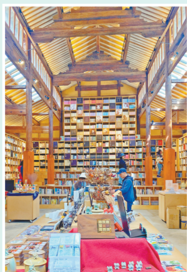
藏在民居里的先锋沙溪白族书局