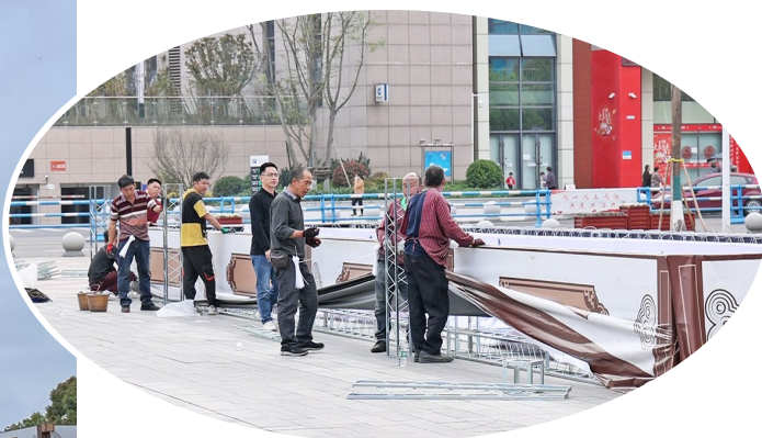
▲ 工作人员正在紧张布置现场 ▲ 半程马拉松赛线路起点合川人民广场

本报讯(记者 甘晓伟 摄影报道)英雄钓鱼城,首马破荆棘!2023重庆合川钓鱼城半程马拉松即将开赛,相信各位小伙伴们都非常激动,目前各项筹备工作进展如何?