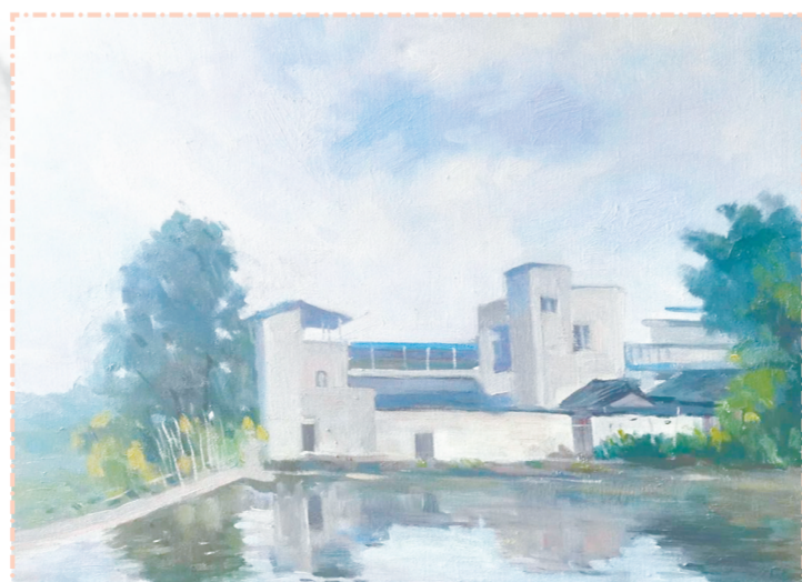
《大石新村美景》 陈小飞