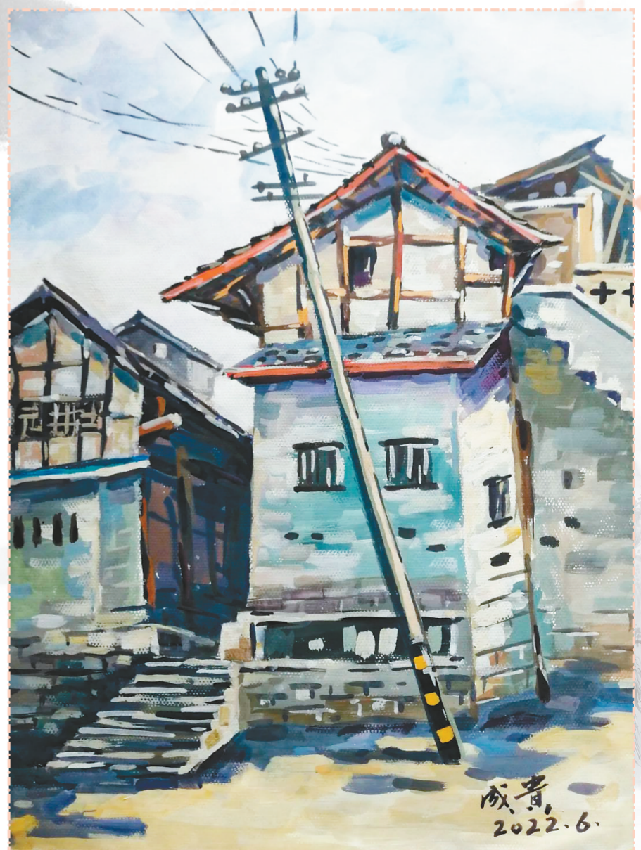
《尖山老街一角》 黄成贵