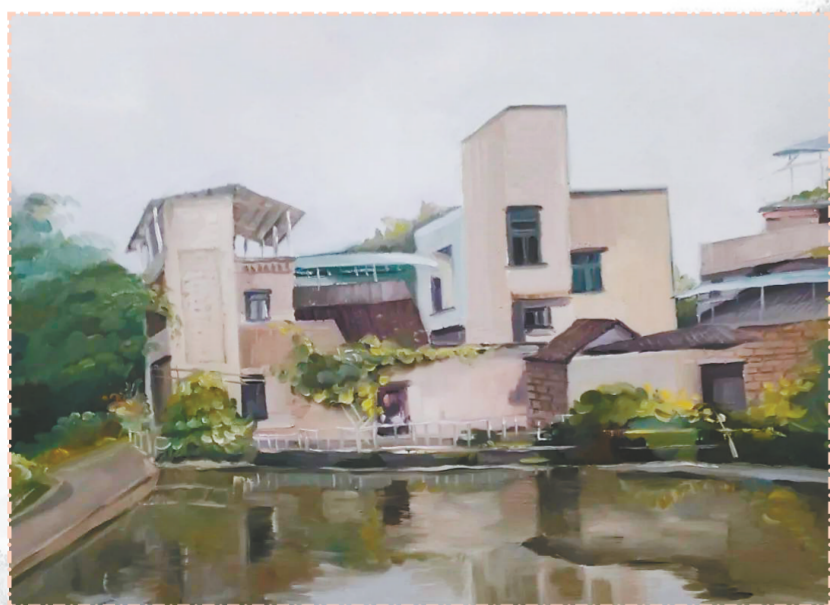
《醉美大石乡村景》 任美玲