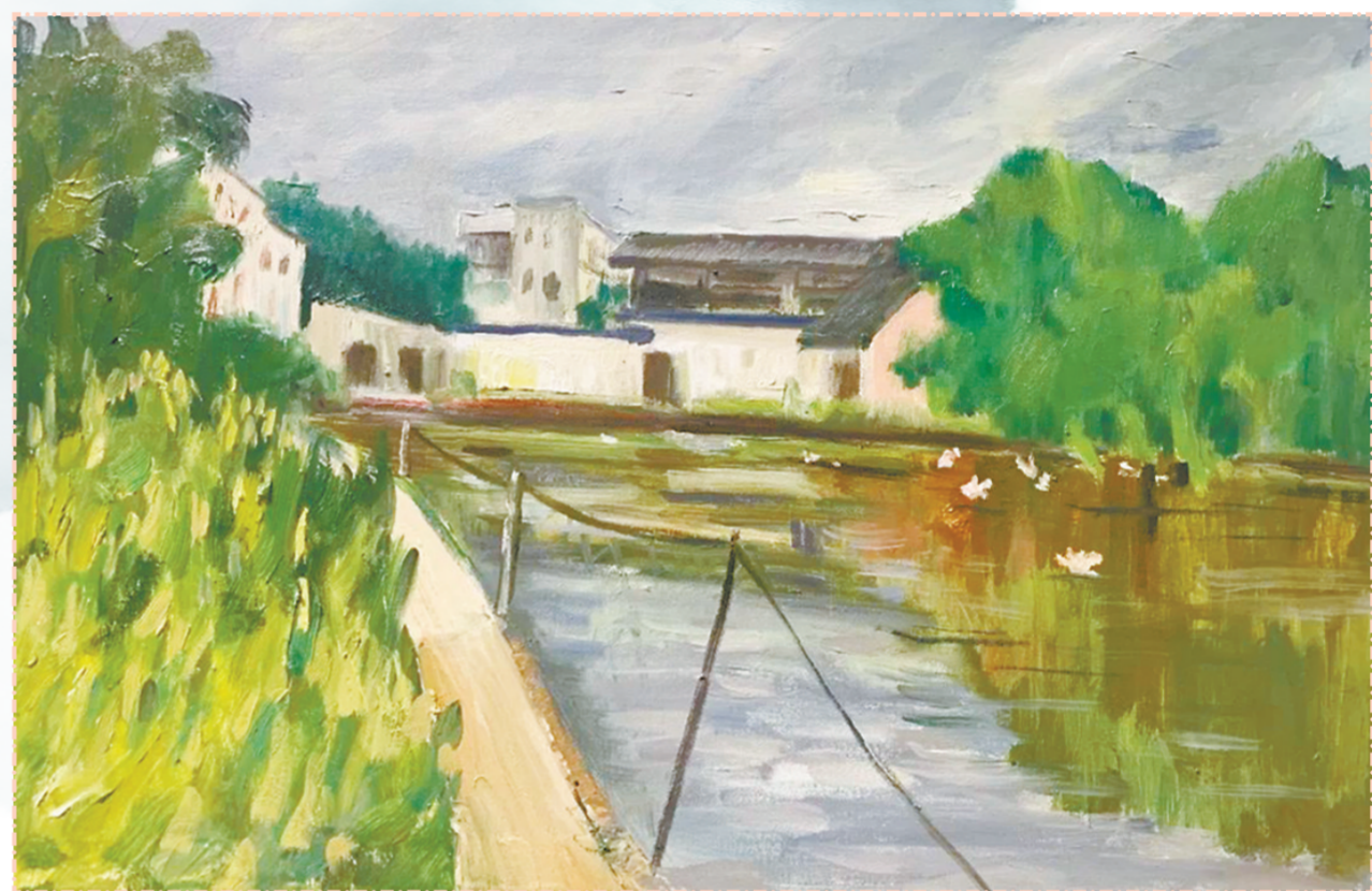
《玄宇风采农家乐》 程佳