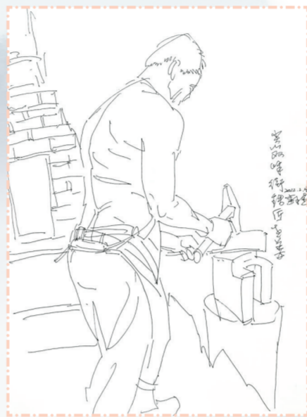
《大石铁匠老姜》 李永生