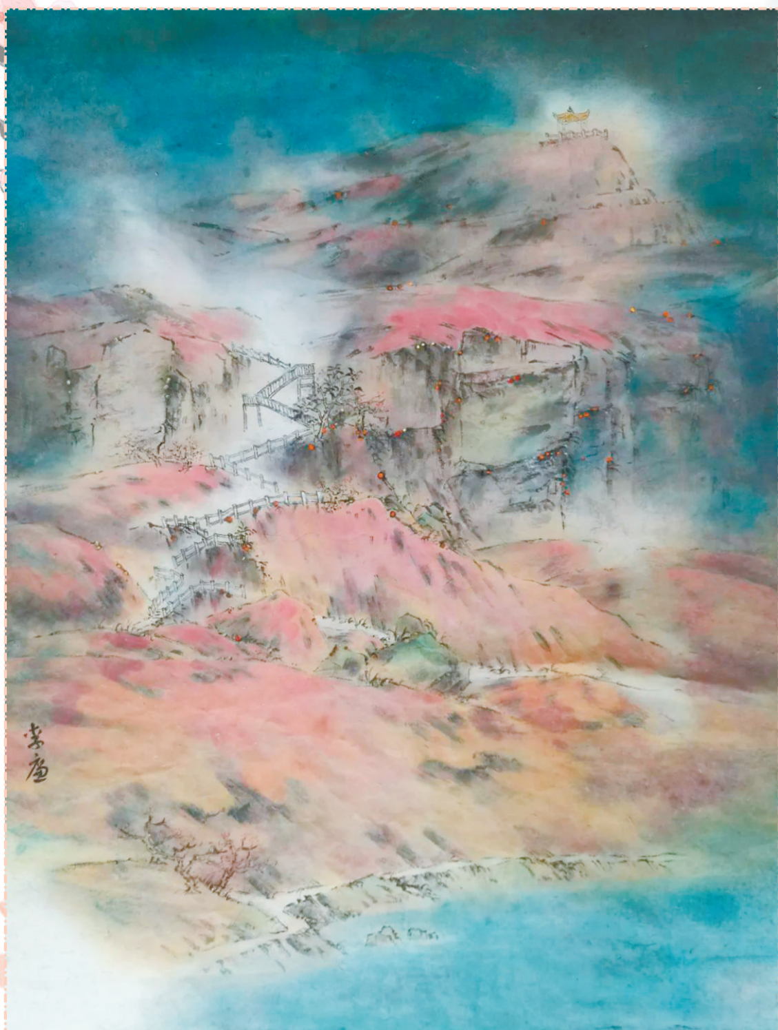
《百丈桃花始盛开》 李廉