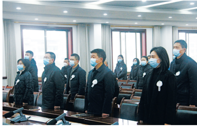
南津街街道党员干部职工收听收看江泽民同志追悼大会现场直播。