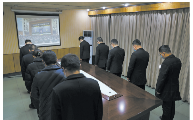
钱塘镇党员干部职工收听收看江泽民同志追悼大会现场直播。