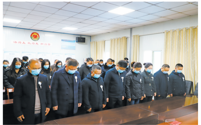
肖家镇党员干部职工收听收看江泽民同志追悼大会现场直播。