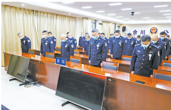
区公安局党员干部收听收看江泽民同志追悼大会现场直播。