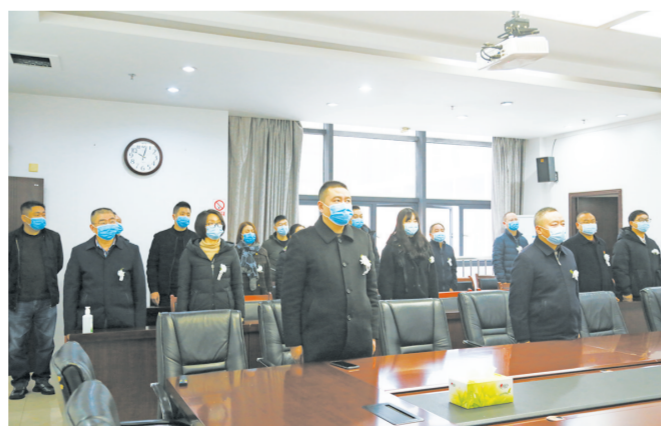
区住房城乡建委党员干部职工收听收看江泽民同志追悼大会现场直播。