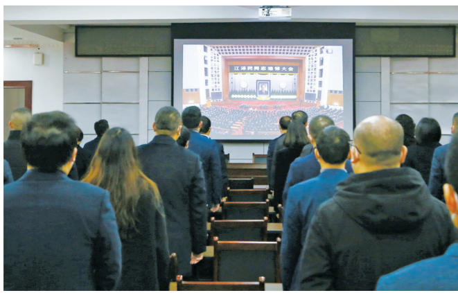
区人社保局党员干部职工收听收看江泽民同志追悼大会现场直播。