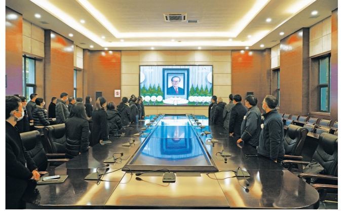
重庆人文科技学院党员干部职工收听收看江泽民同志追悼大会现场直播。