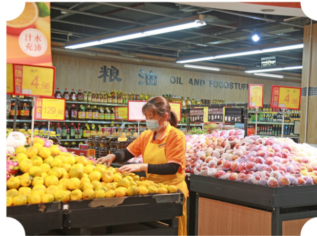
二月二日,重百超市合川南街街店工作人员正在整理货架。