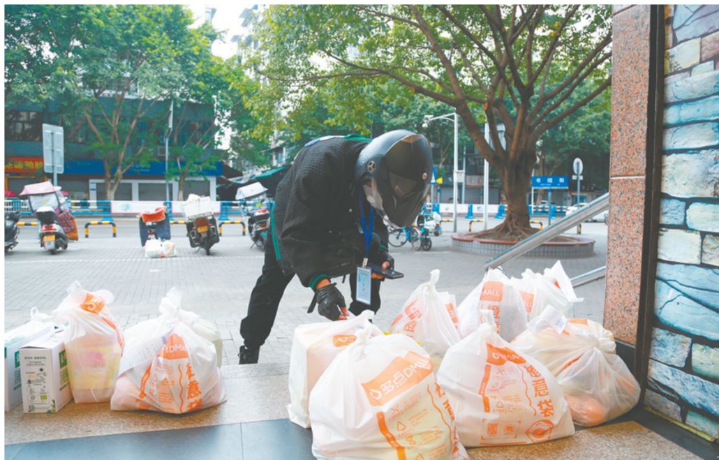
二月二日,南街街道,保供人员线下零接触配送物资。

“你出不去的门,是他们回不了的家;你不想睡的觉,是他们熬不完的夜晚;你起不来的床,是他们赶时间的战场。”网络上流传的这句话,正是志愿者们们的真实写照。在这次疫情防控阻击战中,心怀大爱、不图回报的志愿者们,用实际行动践行初心和使命,守护着群众的平安和健康。