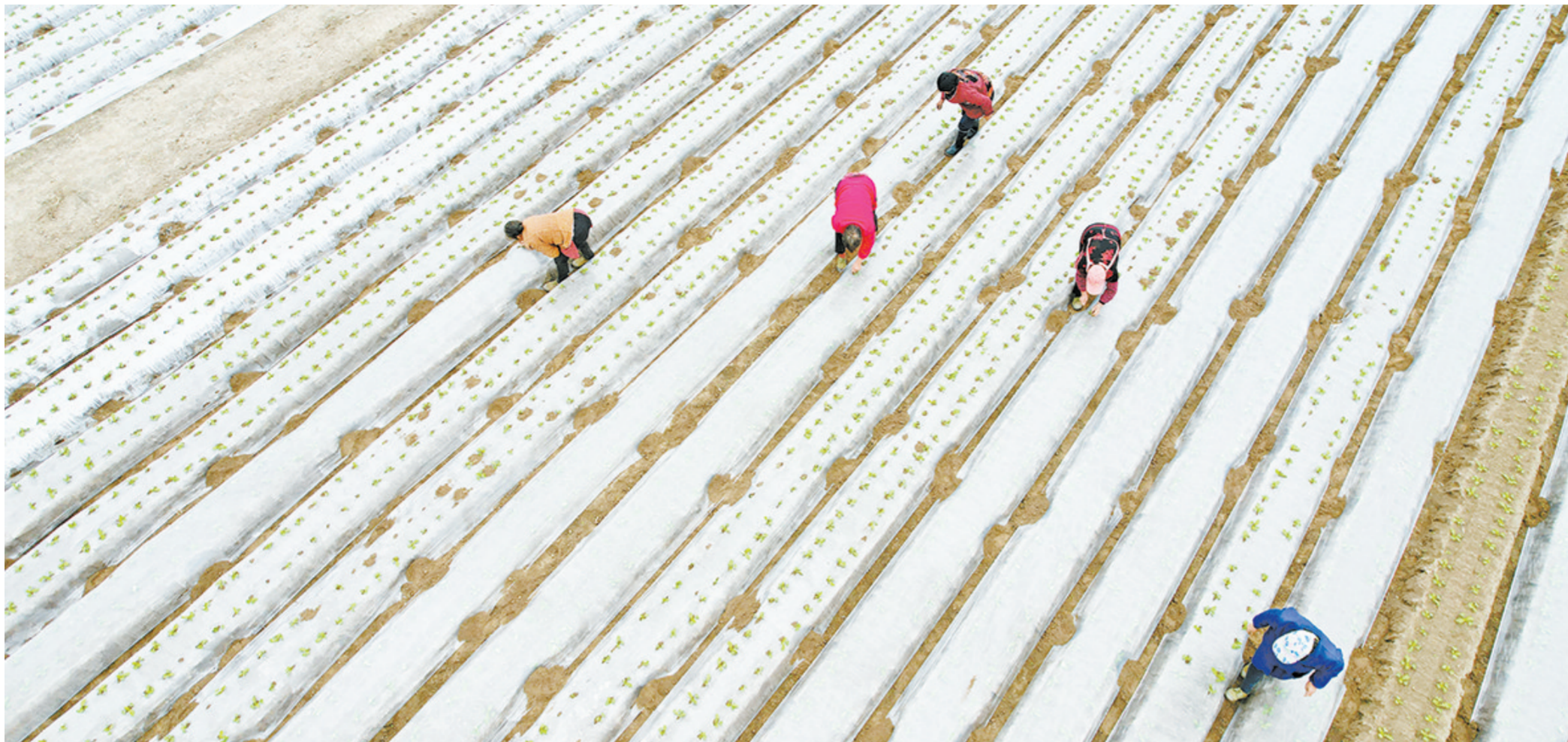
疫情防控与农业生产两不误。11月15日上午, 涪沱镇蔬菜大户正抢抓时令开展冬季蔬菜生产。