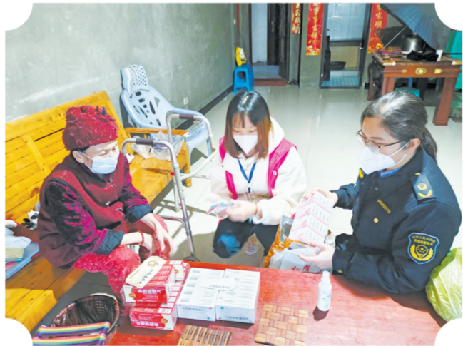
二月二日,太和镇志愿者为老人购药送药。