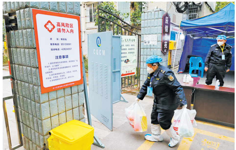
11月15日,合阳城街道较场坝社区,值守人员为封控小区运送生活物资。