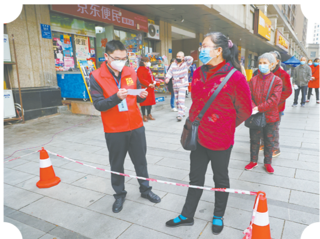
二月二日,合阳城街道滨江国际小区,社区工作人员查看居民出门条。