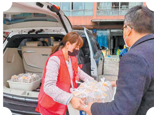
二月二日,钓鱼城街道人大代表、餐饮协会人员给该街道三个社区疫情防控人员送红糖汤圆。