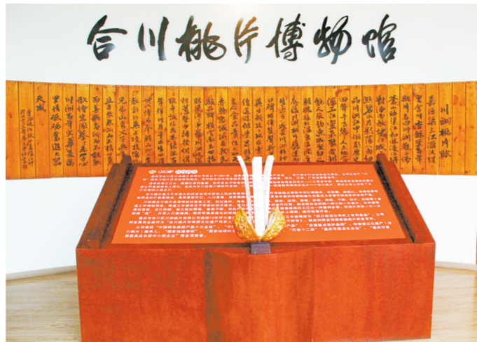
合川桃片博物馆门厅

合川桃片,始创于1840年的合川桃片,走过晚清、民国,迎来中华人民共和国的诞生,见证了国家的改革开放,踏上了建设中国特色社会主义新征程!无论经历什么年代,什么时光,合川桃片的技艺未变、品质未变、口碑未变,其悠久的历史与独特的风味深受广大消费者的喜爱,也成了合川人的骄傲与自豪!