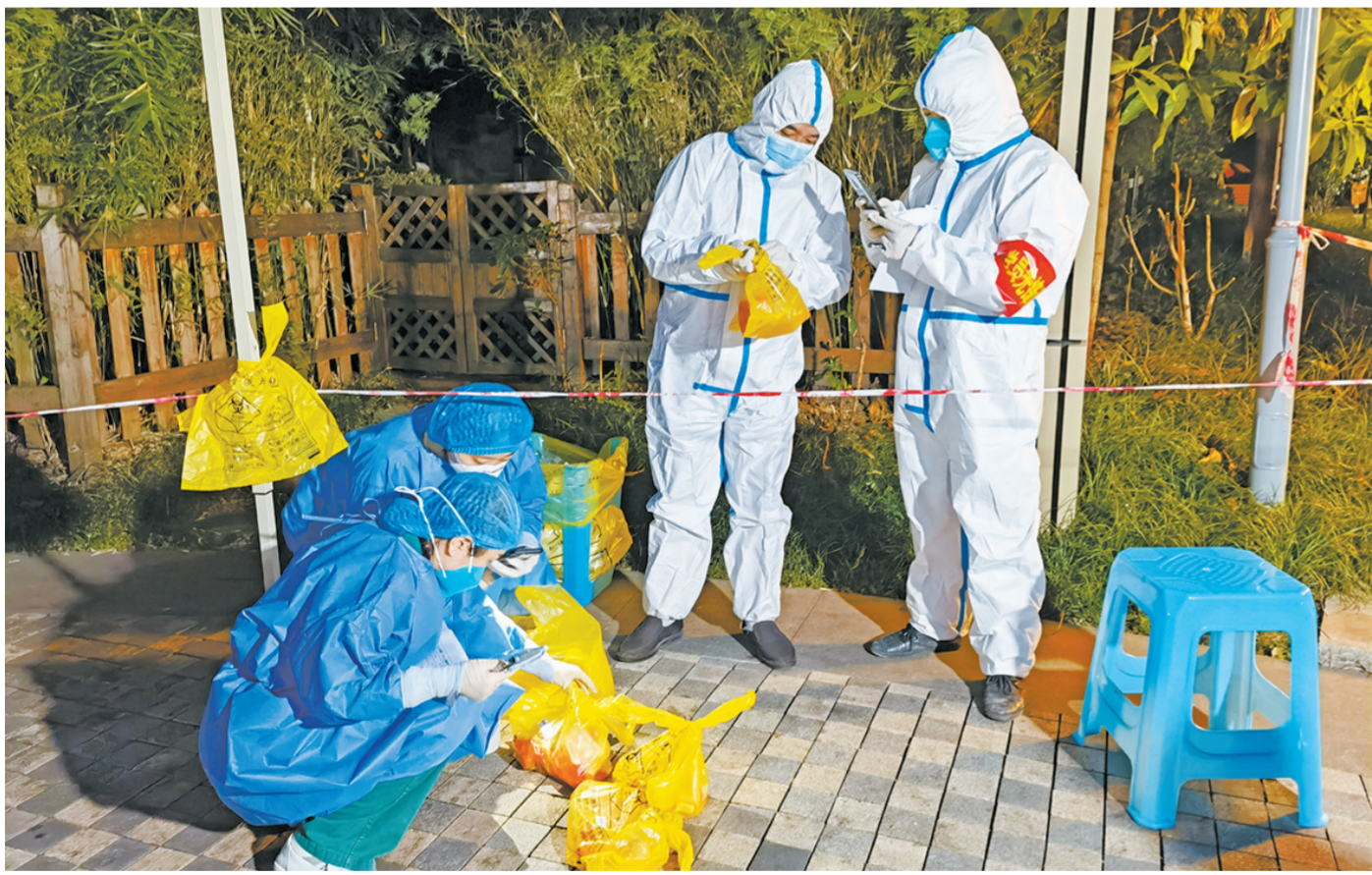
11月13日,钓鱼城街道党员先锋队在社区转移核酸样本。

据悉,下一步,区养老协会将持续开展护理技能、运营管理、安全规范等养老专题培训,不断提高养老从业人员的持证比例和专业素质,从而带动促进养老行业管理标准化、技能流程化、服务优质化。