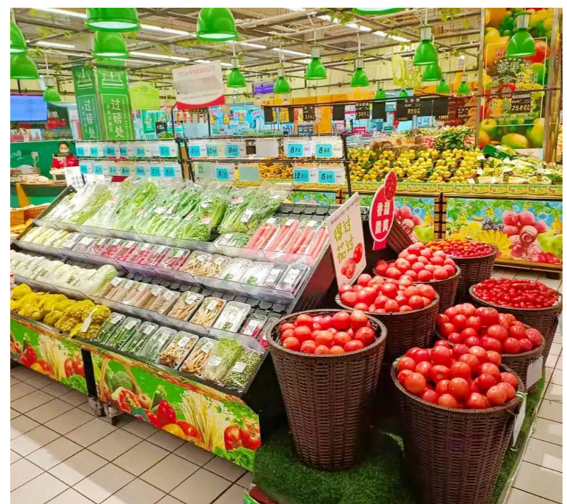
我区各大超市物质充足、品种丰富