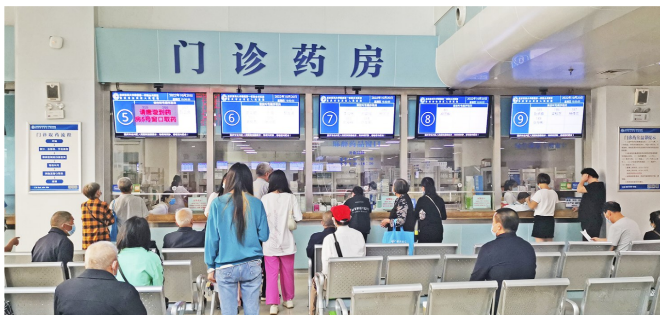
市民正在区人民医院购买集采药品

为打通“团购”药品销售“最后一公里”,让群众就近、低价买到质量可靠、价格优惠的集采药品,区医保局全力推进集采药品进医院工作。目前,全区36家公立医疗机构和3家较大的民营医疗机构参加了集中带量采购。同时,公示集采药品的集中采购价和销售价,做到集中带量采购药品入库、出库、卖出等全周期信息做到可追溯,确保每一盒药品来源明确、去向