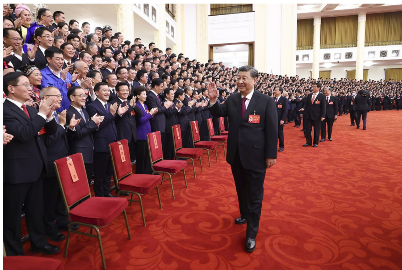
10月23日下午,中共中央总书记、国家主席、中央军委主席习近平等领导同志在北京人民大会堂亲切会见出席党的二十大代表、特邀代表和列席人员,并同大家合影留念。