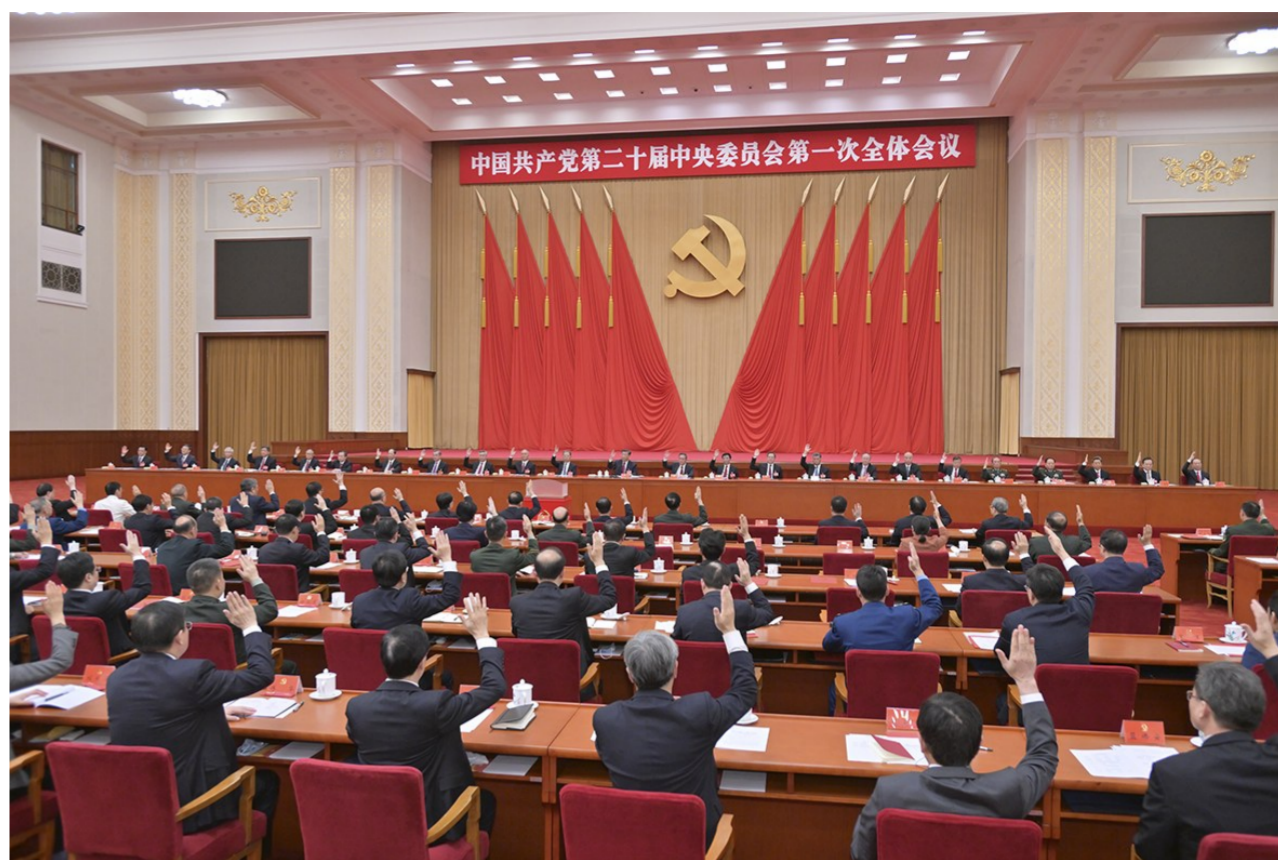
左图:10月23日,中国共产党第二十届中央委员会第一次全体会议在北京人民大会堂举行。习近平同志主持会议并在当选中共中央委员会总书记后作重要讲话。