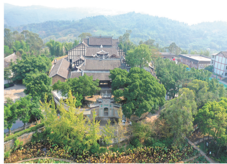
陶行知先生创办的古圣育才学校