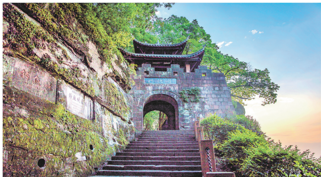
钓鱼城古战场遗址护国门