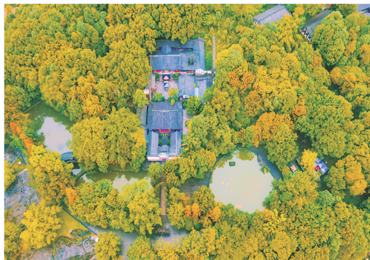
秋色钓鱼城