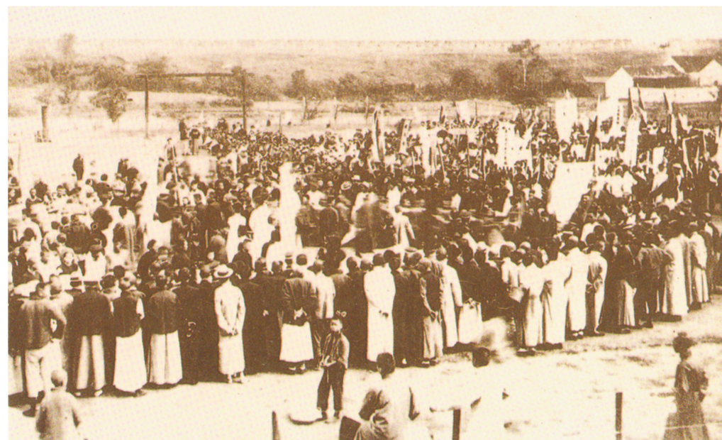
南京平民教育动员大会盛况

了很久的开展平民教育的有效方法——连环教学法。“连还教学法”使陶行知如获至宝。他身边的朋友都成为了他推广的对象。他在给妹妹陶文美的信中写道:“最近,我足迹所到的地方,就是平民教育所到的地方。店里、家里、学校、旅馆、私塾,甚至于庙里,我都去推广平民教育,并且很有乐趣。我过几天还要到军队、工厂、清洁堂、监狱去做推广,连车夫、佣人、厨师也不例外。”