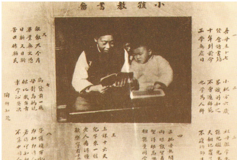
陶行知在家设立“笑山平民读书处”,次子小桃教祖母识字