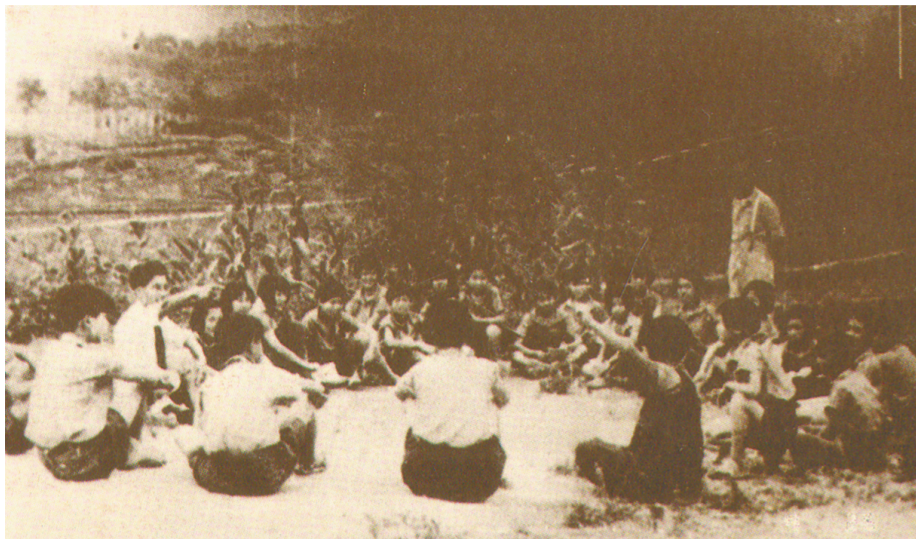
育才学院的孩子们在大自然里学习讨论