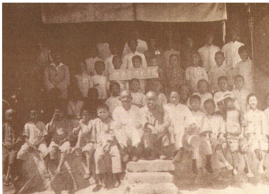
晓庄师生创办的民众学校开学典礼