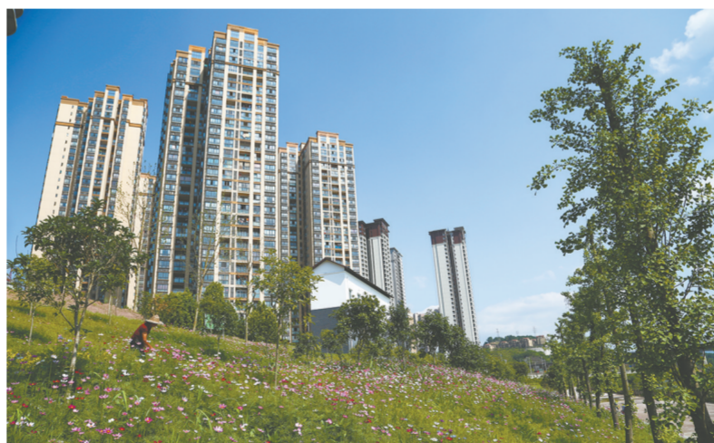
优美的小区环境

像梨园路这样干净整洁有序的农贸市场,在我区还有不少。除了农贸市场,我区还用好用活城市边角地,打造社区公园;突出硬件建设和文化元素,改造老旧小区……在不断地改造升级中,我区进一步完善了城市功能,江城也更加靓丽、更加宜居。