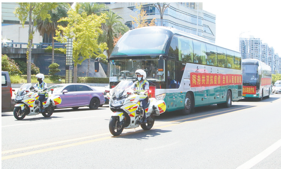
警车护送援合医疗队返程