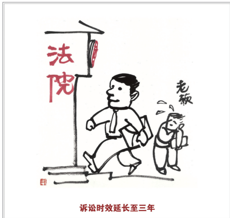
诉讼时效延长至三年

因保护他人民事权益使自己受到损害的,由侵权人承担民事责任,受益人可以给予适当补偿。没有侵权人、侵权人逃逸或者无力承担民事责任,受害人请求补偿的,受益人应当给予适当补偿。(第一百八十三条) 因自愿实施紧急救助行为造成受助人损害的,救助人不承担民事责任。(第一百八十四条)