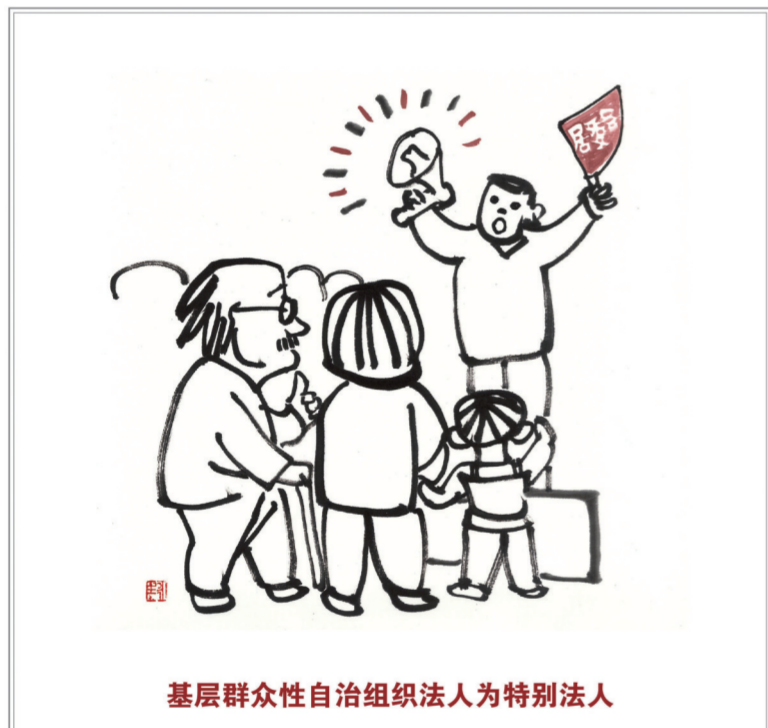
基层群众性自治组织法人为特别法人

不能完全辨认自己行为的成年人为限制民事行为能力人,实施民事法律行为由其法定代理人代理或者经其法定代理人同意、追认,但是可以独立实施纯获利益的民事法律行为或者与其智力、精神健康状况相适应的民事法律行为。(第二十二条)