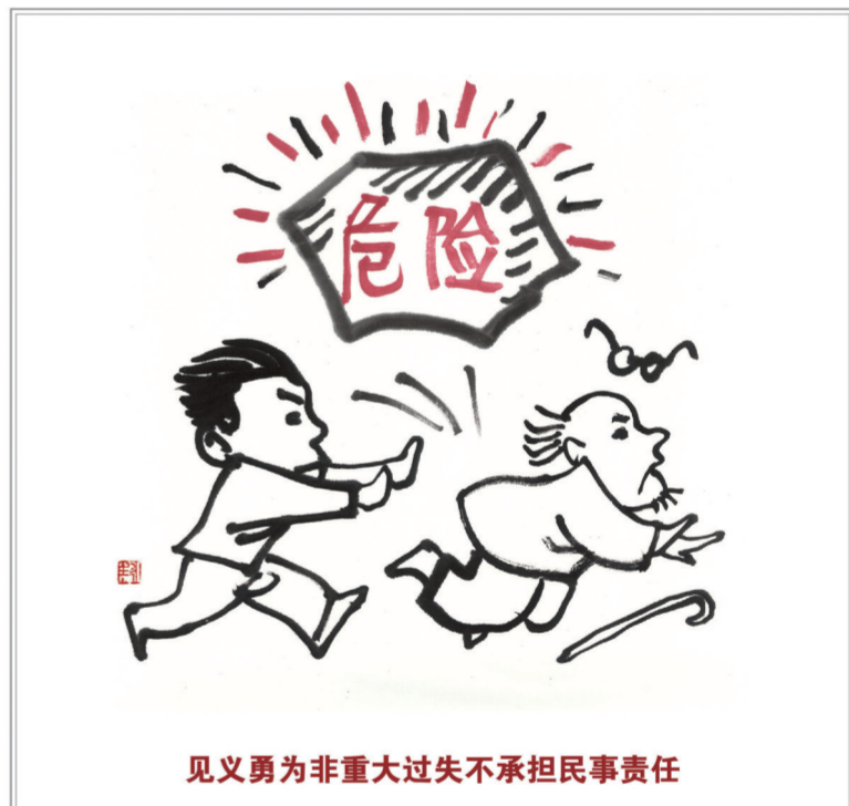
见义勇为非重大过失不承担民事责任

自然人的个人信息受法律保护。任何组织和个人需要获取他人个人信息的,应当依法取得并确保信息安全,不得非法收集、使用、加工、传输他人个人信息,不得非法买卖、提供或者公开他人个人信息。(第一百一十一条) 法律对数据、网络虚拟财产的保护有规定的,依照其规定。(第一百二十七条)