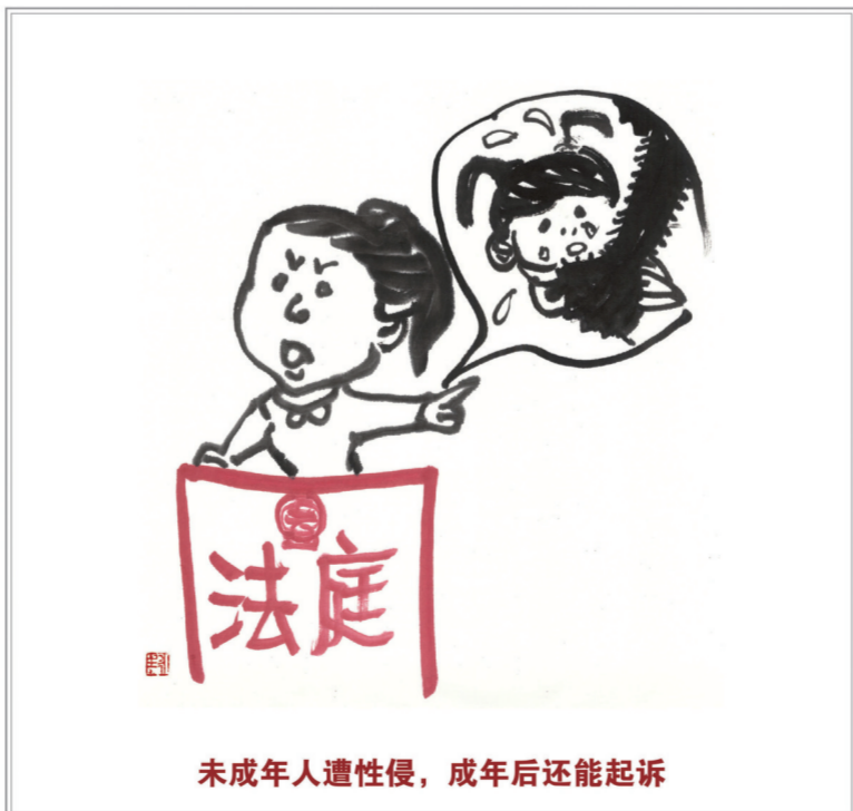
未成年人遭性侵,成年后还能起诉

向人民法院请求保护民事权利的诉讼时效期间为三年。法律另有规定的,依照其规定。(第一百八十八条)