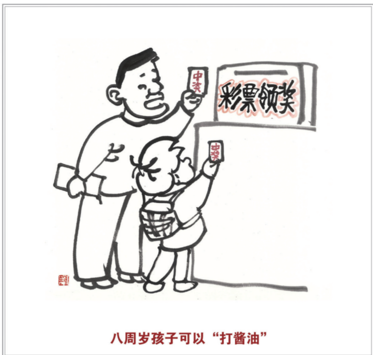
八周岁孩子可以“打酱油”

涉及遗产继承、接受赠与等胎儿利益保护的,胎儿视为具有民事权利能力。但是胎儿娩出时为死体的,其民事权利能力自始不存在。(第十六条)