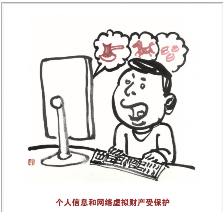
个人信息和网络虚拟财产受保护

居民委员会、村民委员会具有基层群众性自治组织法人资格,可以从事为履行职能所需要的民事活动。未设立村集体经济组织的,村民委员会可以依法代行村集体经济组织的职能。(第一百零一条)