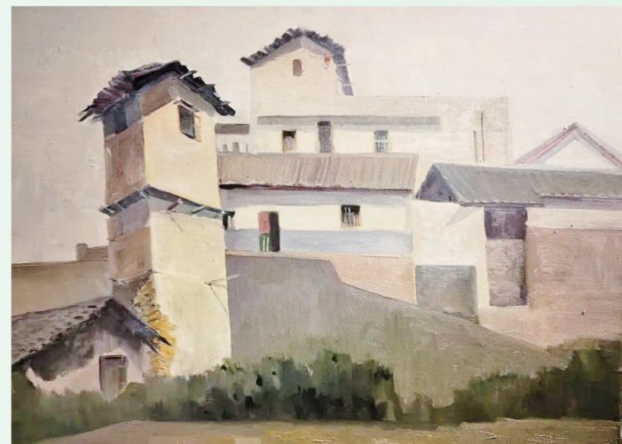
《日照盐井古街》 陈小飞