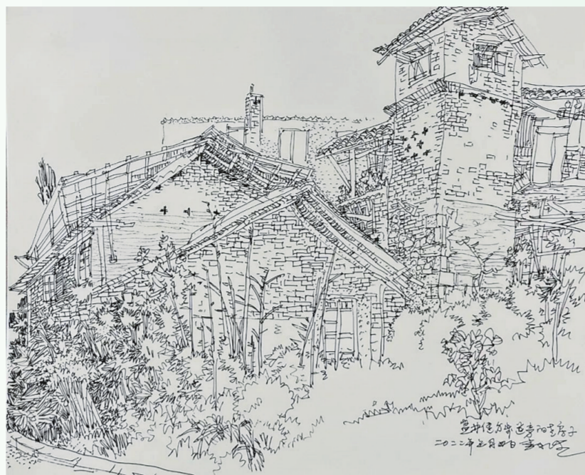
《盐井河边健身步道旁的老房子》 李永生