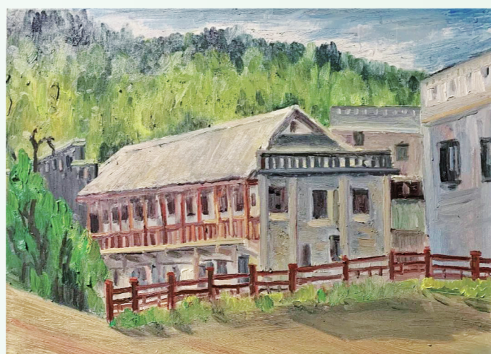
《盐井街道一栋像遵义会址的老房子》 程佳