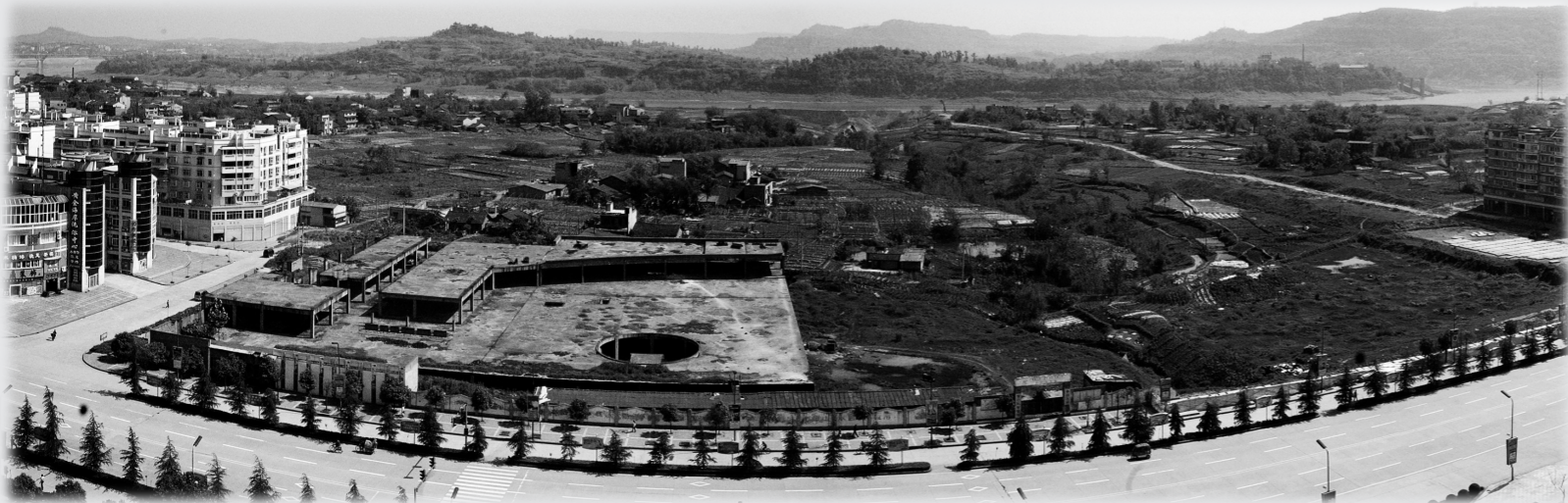
合川区文化艺术中心旧貌 摄于2007年