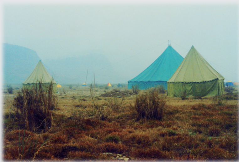
合川张弓滩 摄于2002年