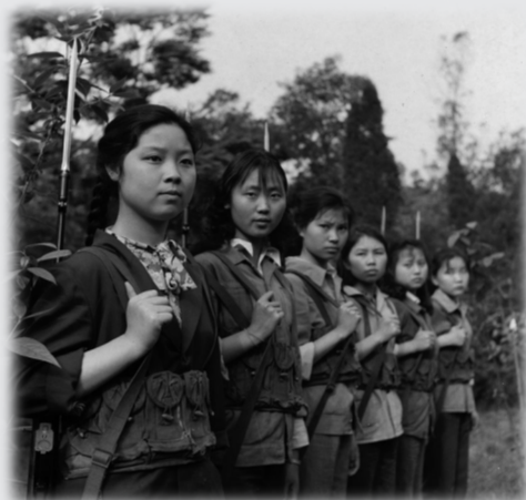
合川丝厂女民兵 摄于1984年