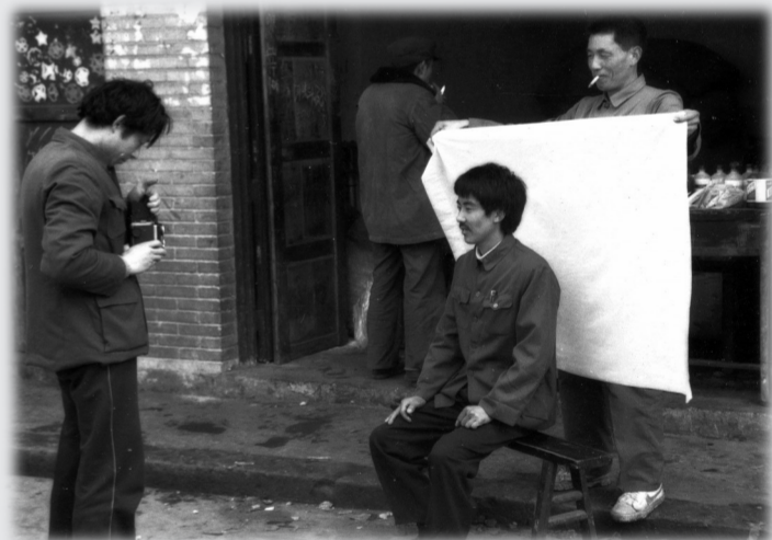
集镇照相馆 摄于1988年