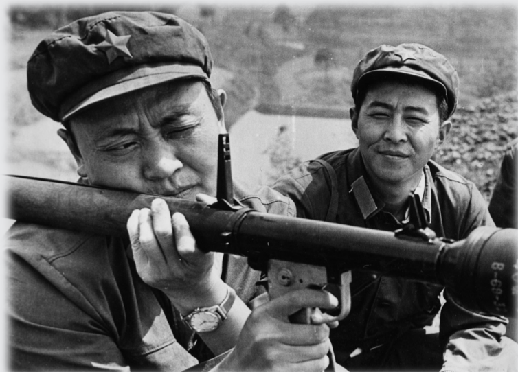
40火箭筒实弹射击 摄于1980年