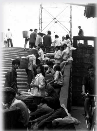
学昌门石梯坎 摄于1982年