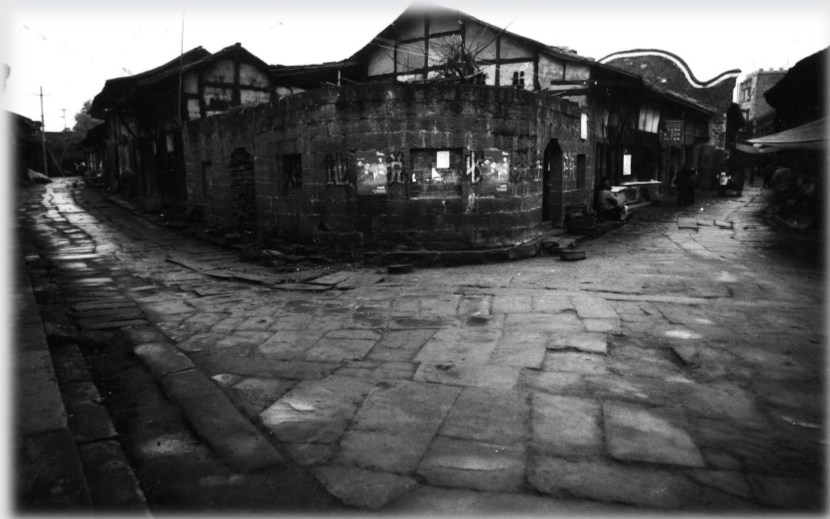
涪滩古街旧貌 摄于2006年