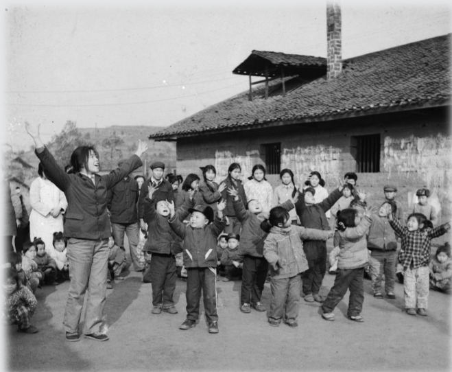
七十代的农村幼儿园 摄于1978年

罗明均,中国摄影家协会会员、中国摄影著作权协会会员、重庆市摄影家协会高级会员、重庆市艺术摄影学会、重庆市新闻摄影协会会员、合川摄影协会创始人之一,先后担任摄影协会副主席、常务副主席、连任两届主席和协会党支部书记;2019年被合川区委宣传部、合川区文联授予合川区首批“德艺双馨艺术家”称号。