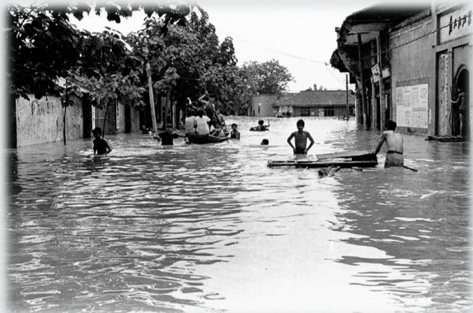
洪水中的塔耳门 摄于1981年