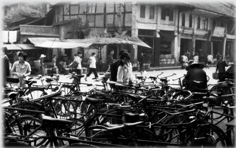
鹿角栅旧貌 摄于1987年