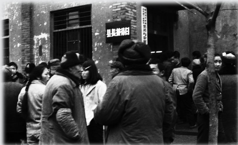
八十年代的县长接待日 摄于1988年