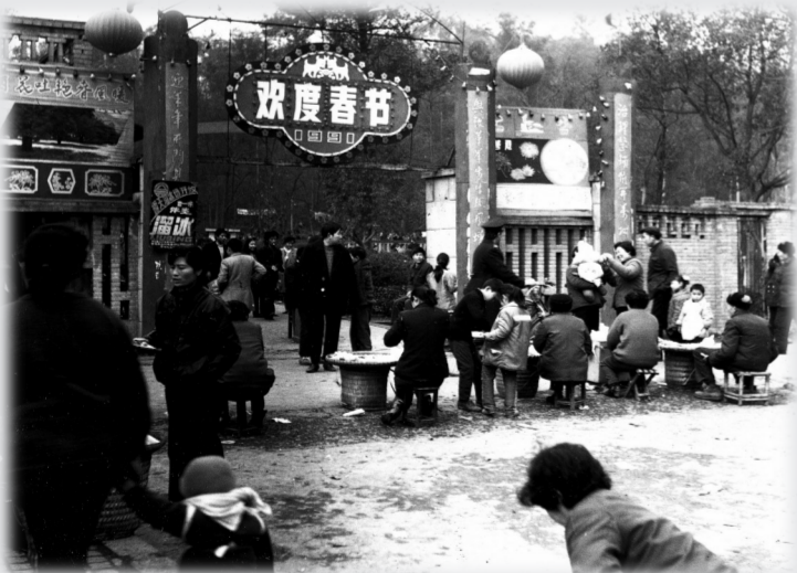
人民公园旧貌 摄于1991年