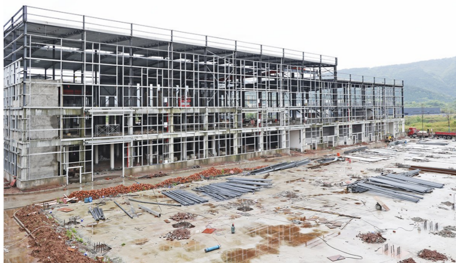
正在建设的金星玻璃项目

与之一路之隔的智能智慧电驱产业化项目正在进行内部施工。该项目由重庆惠康机械制造有限公司投资建设,主要研