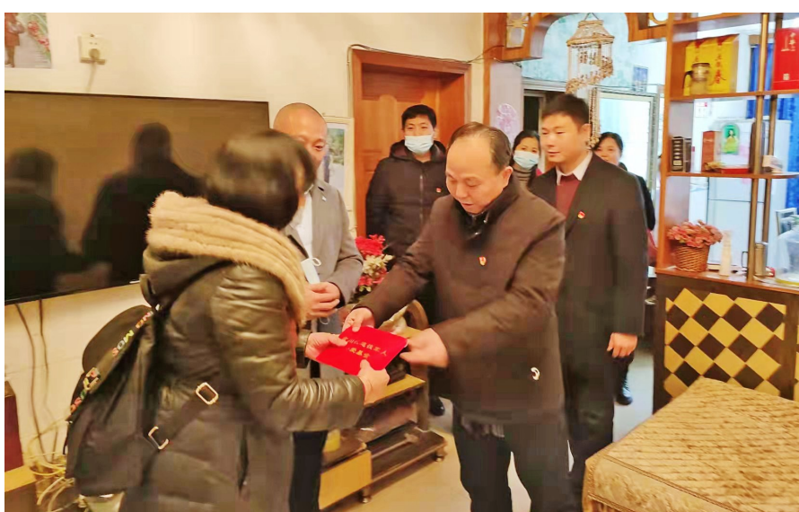
春节期间,区退役军人事务局牵头组织开展退役军人走访慰问活动,本着用真心真情关爱退役军人的原则,充分发挥退役军人服务站的作用开展大范围走访慰问,使退役军人真切地感受到了党、政府以及社会各界的关怀。图为慰问困难优抚对象。

落实应急预案,强化协调调度。建立细化应急预案,认真落实应急队伍、物资和装备,扎实做好防范应对准备工作,确保森林火灾等各类生产事故得到及时、有力、有效的处置。通过各项安全措施的落实,确保了春节期间辖区的安全稳定。