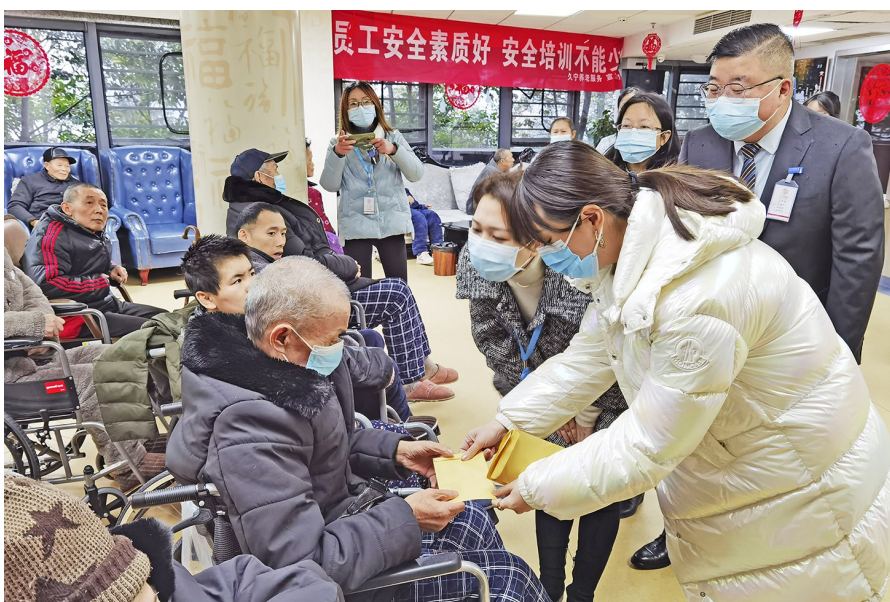
1月28日,钓鱼城街道商会负责人分别到久宁康养中心、公园路社区养老服务社、鼓楼街社区养老服务社等地,对钓鱼城街道32位老人进行新春慰问,向他们送去慰问品和慰问金。

聚焦隐患,力行整改。对检查出的隐患形成台账并予以整改。检查中小学校(幼儿园)8家、餐饮单位134家、企业24家、养老机构4家、旅游宗教场所4家、水库12个等各类重点场所256家,针对排查发现的隐患,部分当场整改,部分下发整改通知书予以整改。