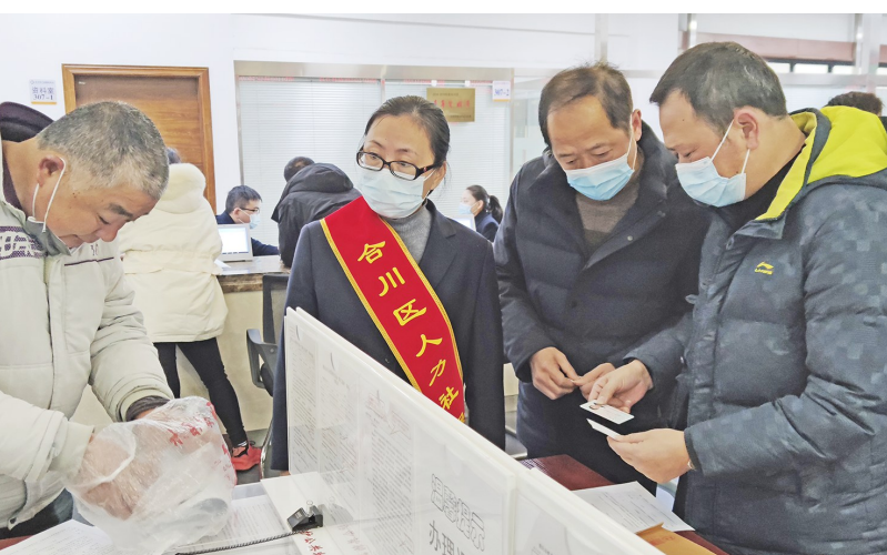
区人力社保局工作人员在办事大厅为群众提供引导服务

区人力社保局在推动服务方式转变上下功夫,科学设置综合受理、咨询服务、自助服务等六大功能区,实施“前台受理+后台审核”,力促服务网络和管理体系不断完善,提升区级服务平台,36个专项窗口精简为9个综合受理窗口,预留3个潮汐窗口,增设24个后台。按照“全员受理+办理”目标,常态化开展“专训+岗训”20期、2000人次,实现三级经办人员培训全覆盖。