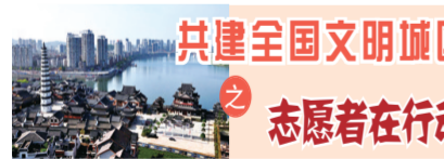
共建全国文明城区 志愿者在行动

截至目前,区民政局已开展送汤服务7次,惠及空巢老人500余人次,让老人们感受到浓浓的关怀和温暖。