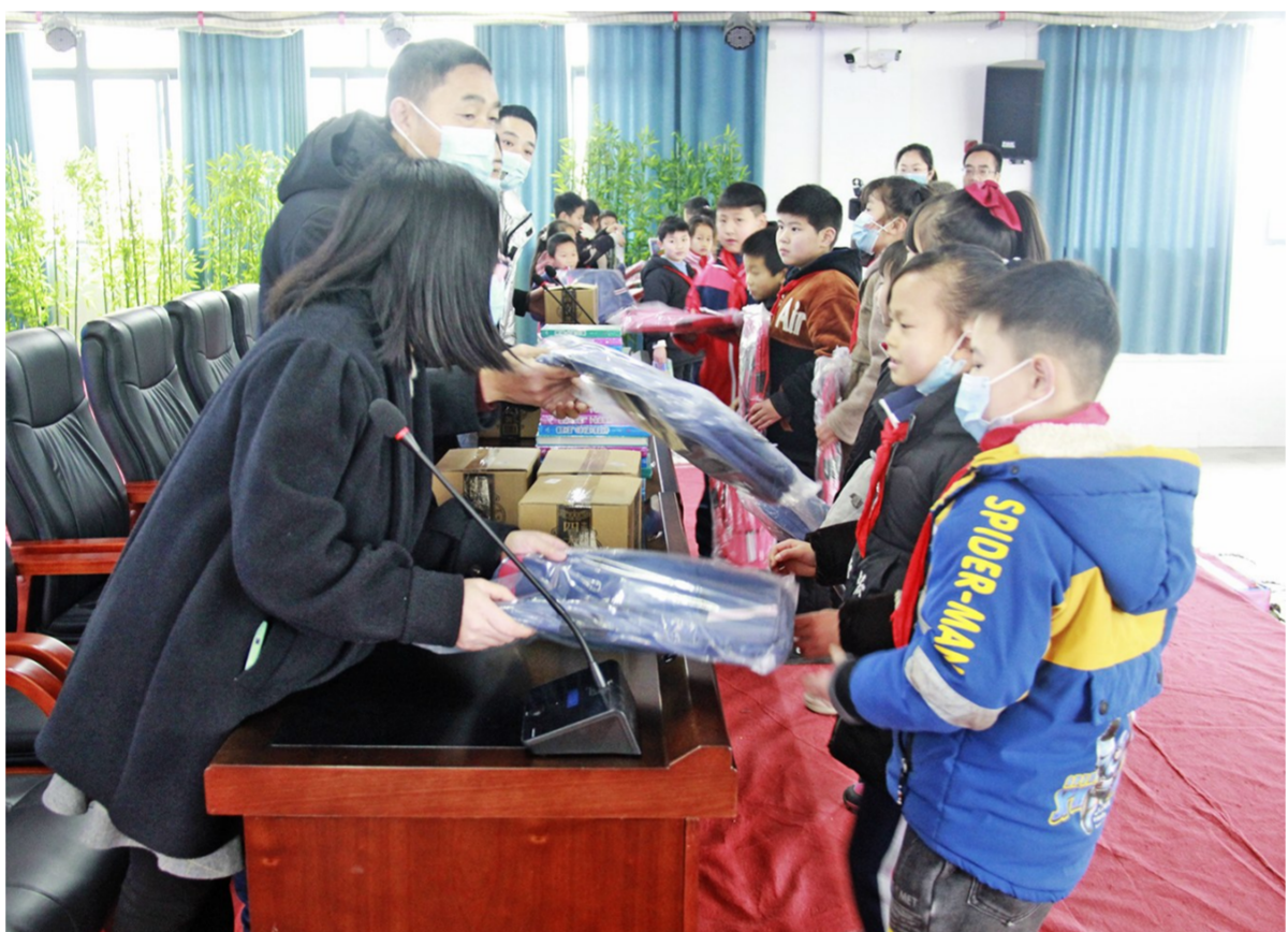
1月18日,乡村振兴驻龙市镇工作队联系到区青年企业家联谊会开展点亮“微心愿”活动,为龙市镇4所小学共计100余名学生送去书包、课外读物、篮球、羽毛球等学习用品和体育用品。