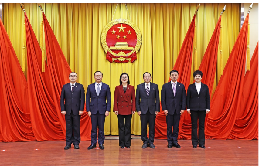
新一届区人大常委会领导班子亮相