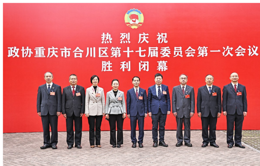
新一届区政协领导班子亮相