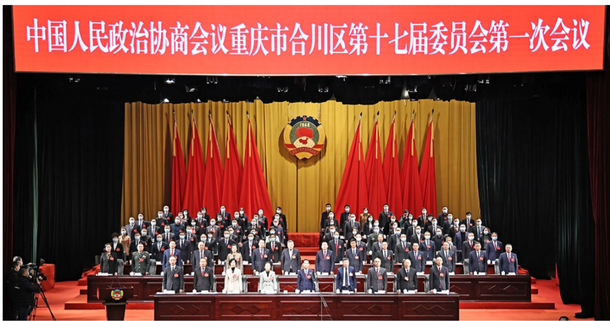
1月14日上午,区政协十七届一次会议闭幕会现场。

本报讯(记者 任洋)1月14日上午,政协重庆市合川区第十七届委员会第一次会议圆满完成各项议程后,在区文化艺术中心胜利闭幕。