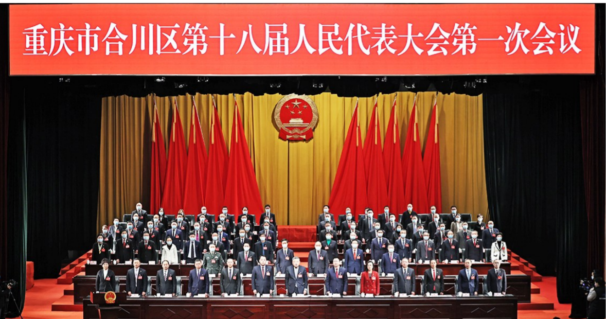
1月14日下午,区十八届人大一次会议闭幕会现场。记者 李文静 摄

本报讯(记者 罗洪)1月14日下午,重庆市合川区第十八届人民代表大会第一次会议在圆满完成各项议程后胜利闭幕。