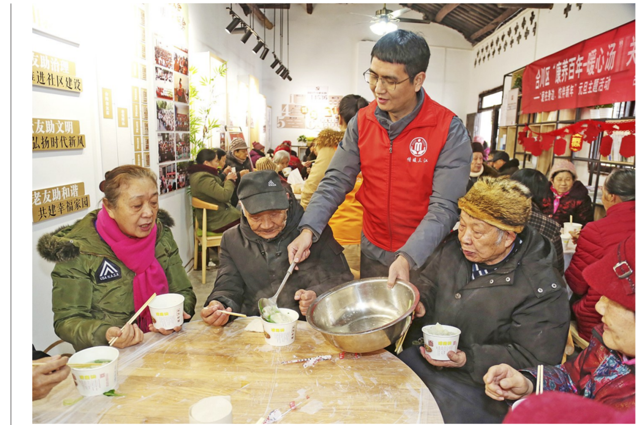
2021年12月31日,合阳街道开展“爱在身边·饺伴新年”元旦主题活动,组织辖区老年人以集体参与的形式,看表演、包饺子、吃饺子,共同迎接新年到来。来自辖区的52位老人齐聚一堂,热热闹闹迎接新年。

青年志愿者还拿出精心准备的蛋糕,让即将过生日的30多名小朋友围拢在一起,共同唱响生日歌;还向孩子们捐赠了画笔、手套、围巾等学习生活用品组成的“助学关爱大礼包”。